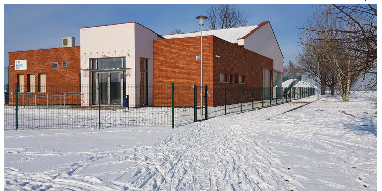
Świetlica w Żernikach Małych

takie miejsca spotkań, jakimi są świetlice wiejskie w naszej gminie.