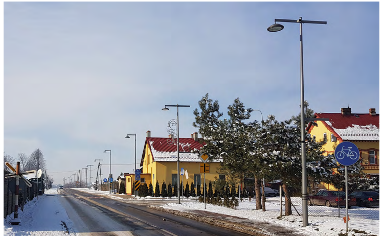
Droga w Kobierzycach