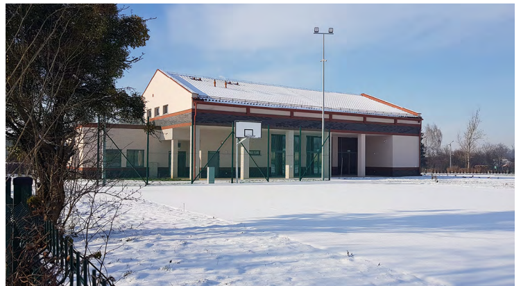
Świetlica w Ślęzie