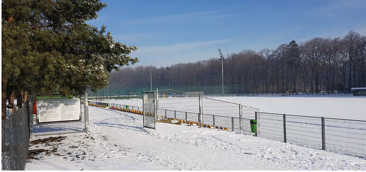
Stadion w Kobierzycach

- W poprzednim numerze biuletynu informacyjnego «Kobierzycze - Moja Gmina Moja Wieś» dokonał Pan przeglądu najważniejszych inwestycji Gminy Kobierzycze w 2020 roku. Teraz czas porozmawiać o planach na rok bieżący. Czego mogą oczekiwać mieszkańcy naszej gminy?