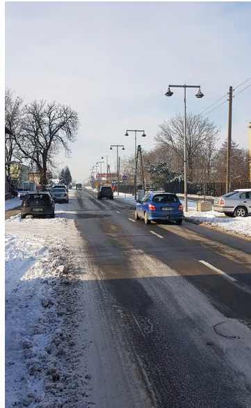
Oświetlenie w Kobierzycach

powinny być w każdej miejscowości, gdyż pełnią bardzo wiele istotnych funkcji w życiu mieszkańców naszej gminy. Po pierwsze są miejscem, gdzie można się spotykać i rozwijać swoje zainteresowania, pasję, czy też podnosić umiejętności w wielu dziedzinach na różnego rodzaju kursach i szkoleniach. W świetlicach wiejskich odbywają się uroczystości rodzinne, różnego rodzaju zabawy, a każdy niezależnie od wieku, może miło tam spędzić czas. Poza tym, są miejscami, które integrują mieszkańców i kształtują poczucie wspólnoty. Dlatego też powoli, ale bardzo konsekwentnie zmierzamy do zakończenia tego programu. Ostatnio nasza gmina wzbogaciła się o kolejne cztery takie obiekty w Żernikach Małych, Krzyżowicach,