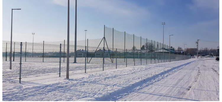
Ślęzańsko-Bieliański Obiekt Sportowo-Rekreacyjny

Ślęzie i Księginicach, a w tym roku planujemy remont świetlicy w Rolantowicach i przymierzamy się do budowy obiektu w Nowinach. Mam nadzieję, że świat, w którym obecnie przyszło nam żyć, powróci do «normalności» i takie obiekty będą mogły służyć mieszkańcom zgodnie ze swoim przeznaczeniem, tak jak to było przed pandemią koronawirusa. Wiele zależy będzie od aktywności radnych, sołtysów i samych mieszkańców. Mnie osobście bardzo brakuje spotkań z ludźmi na zebraniach wiejskich, rozmów i wymiany poglądów niemal na każdy temat. Szczerze mówiąc, mam dość tych spotkań «on line» za pomocą komputerów, czy tabletów, po prostu tęsknię za rozmową «w cztery oczy», bez konieczności zachowania stosownego dystansu i zakładania maseczek. Miejmy nadzieję, że dawne czasy powrócą i wtedy jeszcze bardziej docenimy