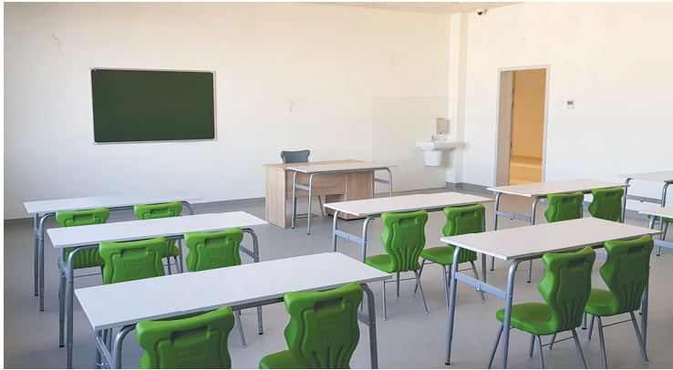
Gabinet lekcyjny w SP w Bielanych Wrocławskich