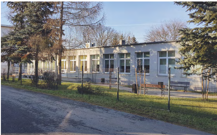
Dzienny dom opieki dla seniorów w Tyńcu Małym

Jak widać plany są ambitne i wymagają olbrzymich środków finansowych na ich realizację.