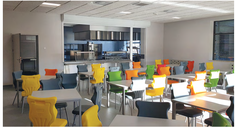
Kuchnia i jadalnia w SP w Bielanych Wrocławskich

Piotr Kopeć Zastępca Wójta Gminy Kobierzyce – Niezależnie od obiektywnych problemów w trakcie trwania budowy, spowodowanych przez pandemię i wszystkim, co jest z tym związane (m.in. czasowy brak dostaw materiałów czy wzrost ich cen) sprawiło, że pojawiały się obawy o terminowe zrealizowanie tej, jakże dla nas ważnej, inwestycji. Dziś możemy powiedzieć, że mieliśmy szczęście trafić na firmę Prefabrykat, która wykazała się dużym profesjonalizmem, czy to w zakresie samych prac budowlanych, czy też w pokonywaniu