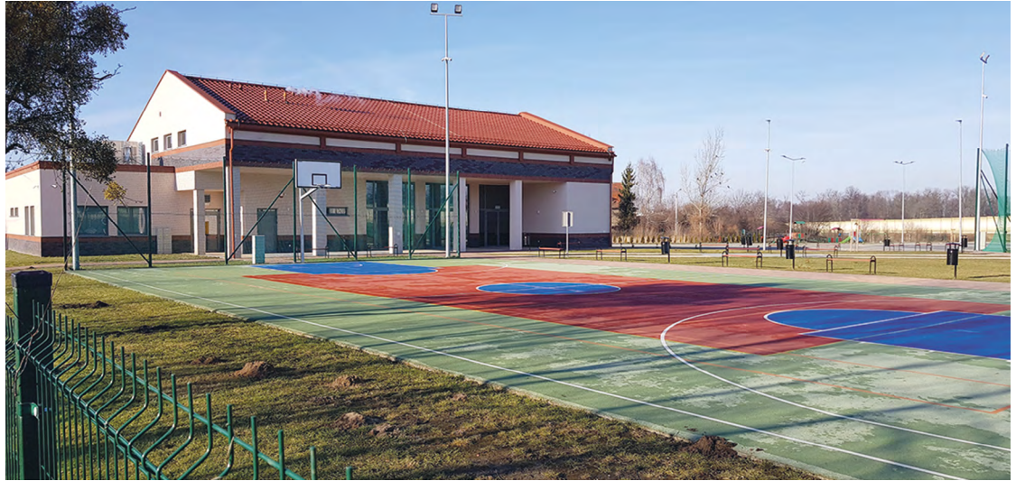
Świetlica i boiska sportowe w Śleżcu