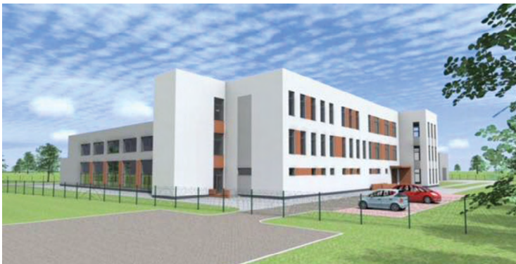
Wizualizacja ZSP w Pustkowie Żurawskim

Aktualnie na terenie Gminy Kobierzyce działa 7 publicznych przedszkoli i punktów przedszkolnych oraz 2 żłobki. Trwają prace projektowe kolejnej placówki w Domasławiu. Dodatkowo każda szkoła posiada oddziały przedszkolne czyli tzw. zerówki. W gminie znajduje się również 13 placówek niepublicznych. Gracjana Rutkowska