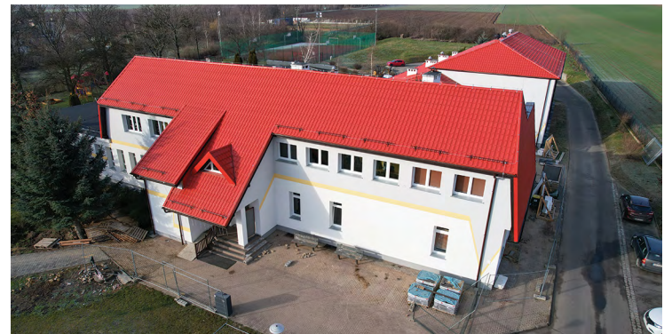
Szkoła w Pustkowie Wilczkowskim