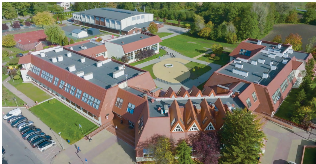
ZSP w Kobierzycach

– Najbliższe plany to rozbudowa szkoły w Tyrńcu Małym. Gmina uzyskała już pozwolenie