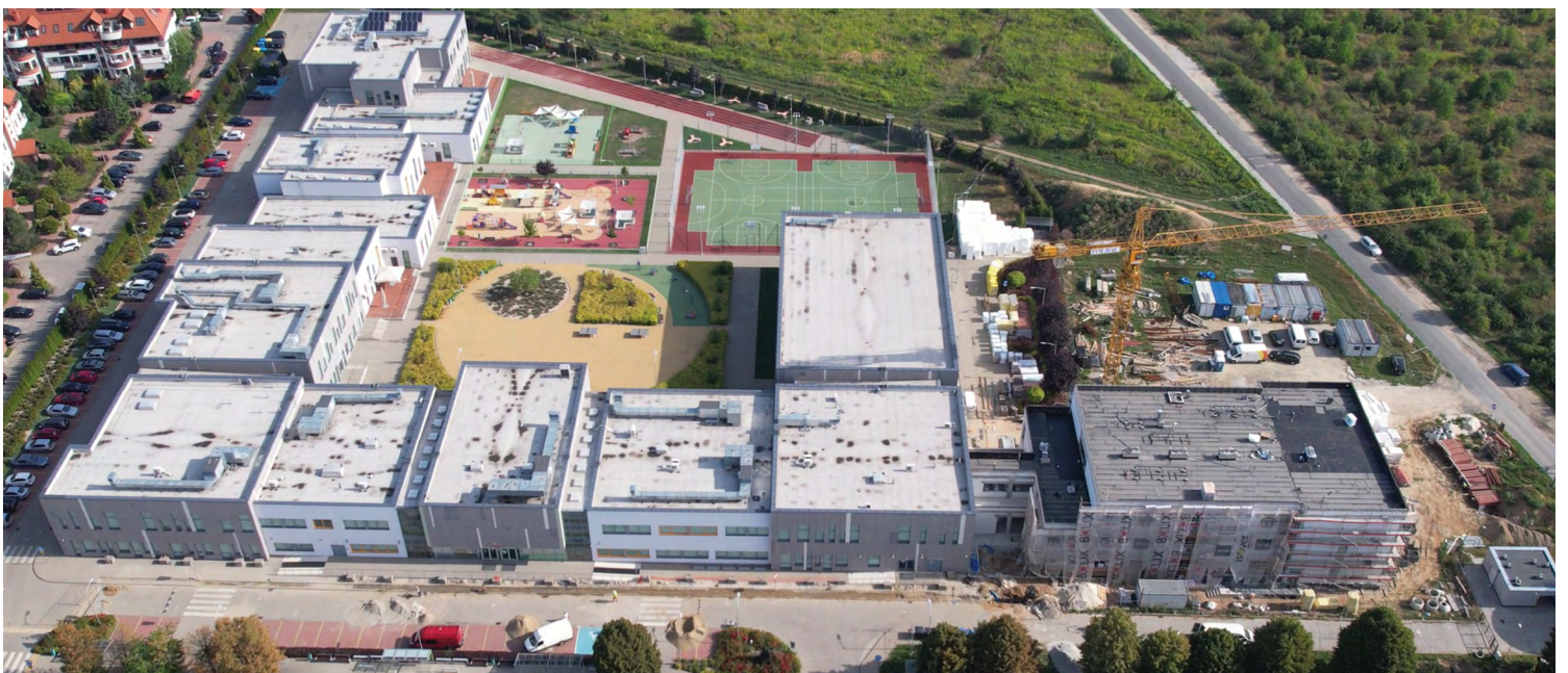
ZSP w Wysokiej