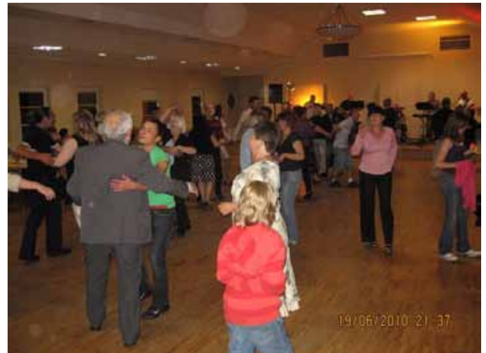
Zabawa taneczna w Bielanych Wrocławskich

Okres wakacyjny, to tradycyjnie czas wiejskich zabaw i festynów w Gminie Kobierzyce.