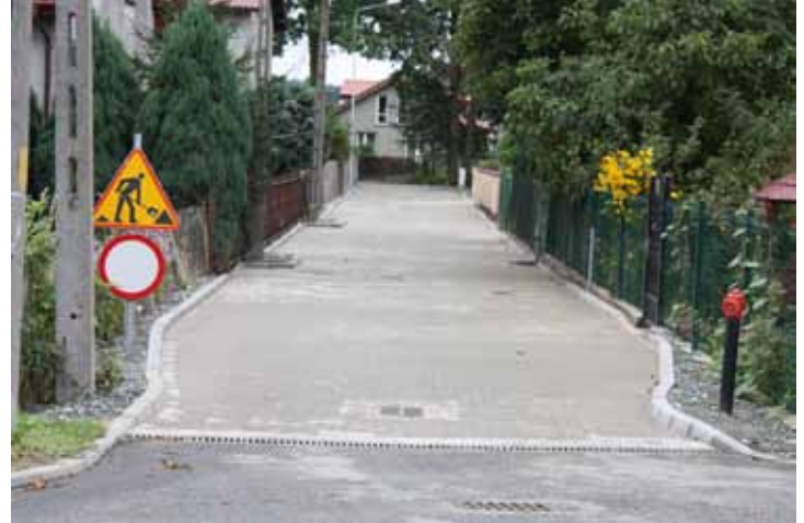
Ul. Zaciszna w Tyńcu Małym