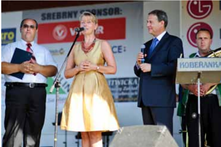
Lidia Geringer de Oedenberg Posel do Parlamentu Europejskiego ufundowała nagrody w postaci zaproszenia do Parlamentu Europejskiego dla twórców najpiękniejszego wieńca, przedstawiciela najlepszego sołectwa oraz reprezentanta zwycięskiego zespołu folklorystycznego.