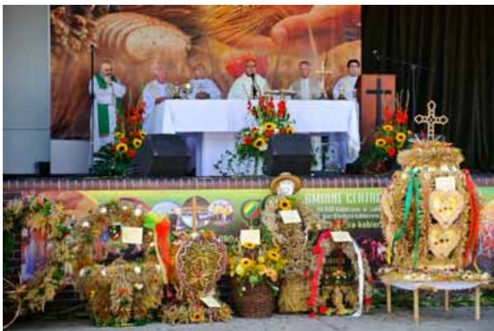
Msza Święta Dożynkowa.