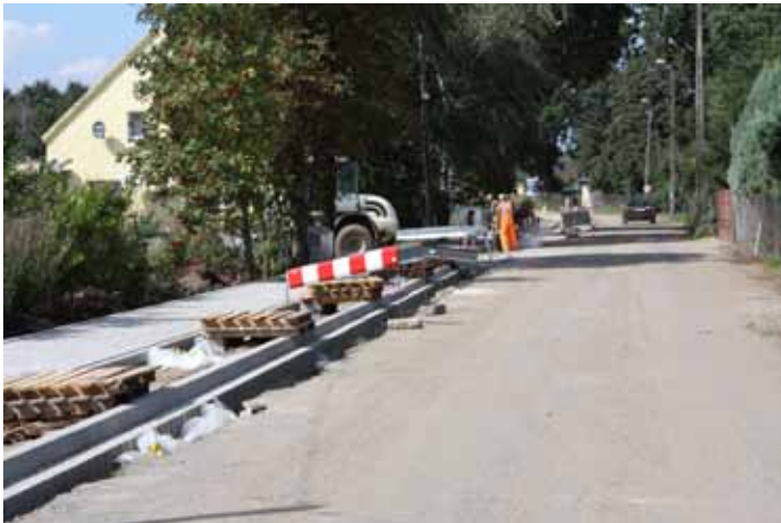
Chodnik w Kuklicach

Ryszard Pacholik - Na zebraniach wiejskich otrzymywaliśmy sygnały o tym, że dzieci nie zawsze mogą bezpiecznie dojść do szkoły, bowiem nie wszędzie powstały jeszcze chodniki.