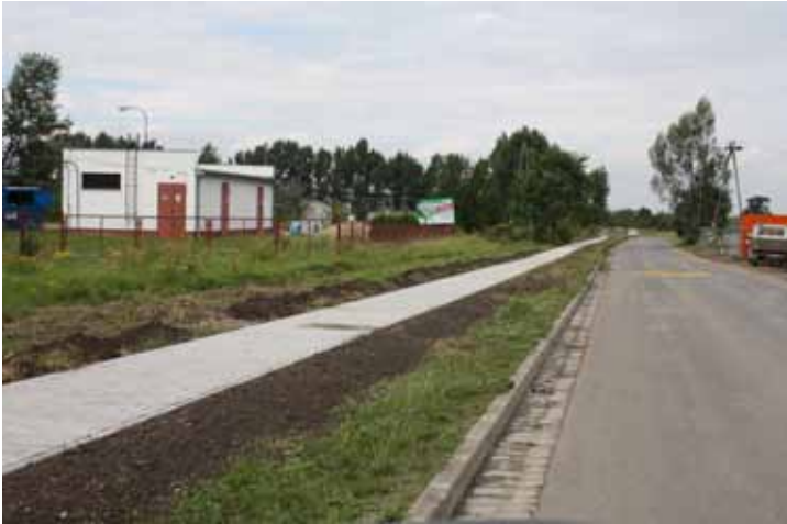
Chodnik przy ul. Błękitnej w Bielana Wrocławskich

W poprzednim numerze biuletynu samorządowego „Moja gmina- moja wieś” przedstawiliśmy opis inwestycji, które są wykonywane w naszej Gminie. Kilka z nich zasługuje na szczególne wyróżnienie.