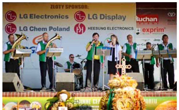
Występ orkiestry dętej Kobeřanka.