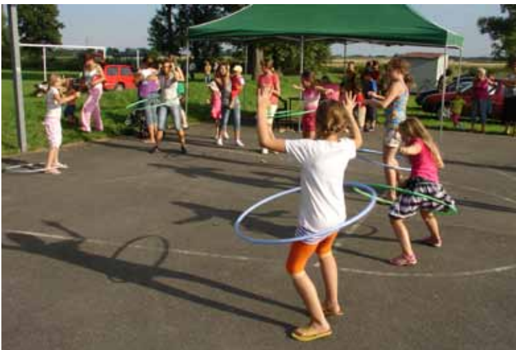
Konkursy dla dzieci w Tyńcu nad Ślężą