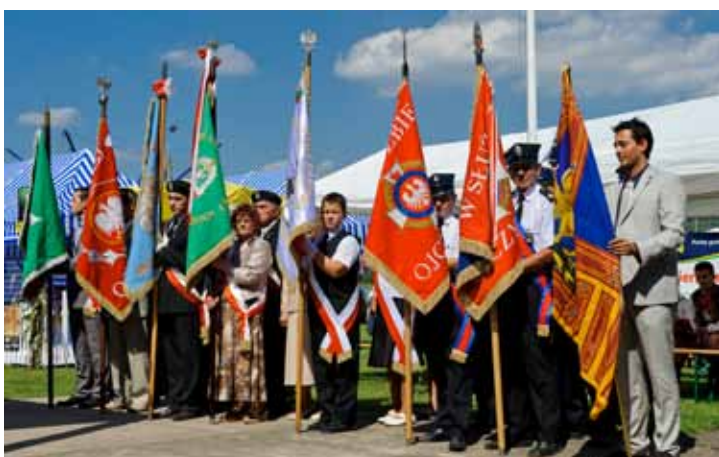
Poczty sztandarowe w trakcie Mszy Świętej.