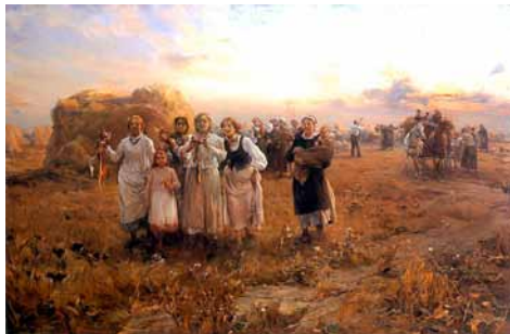
Obraz „Dożynki”, Alfreda Wierusza Kowalskiego

Jednym z najpiękniejszych, a na pewno największych świąt polskich rolników są dożynki. Są one symbolicznym zwieńczeniem całorocznej pracy, organizowane tradycyjnie po zakończeniu prac polowych, gdy są już zebrane plony.