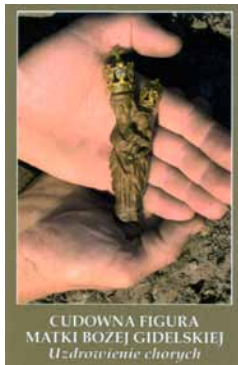
CUDOWNNA FIGURA MATKI BOŻEJ GIDELSKIEJ Uzdrowienie chorych

W niedzielny słoneczny poranek 5 sierpnia br. grupa emerytów i rencistów Gminy Kobierzycze wybrała się do Sanktuarium Matki Bożej Gidelskiej - patronki rolników i górników, posiadającej moc uzdrawiania chorych.