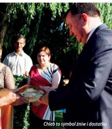
Chleb to symbol żniw i dostatku