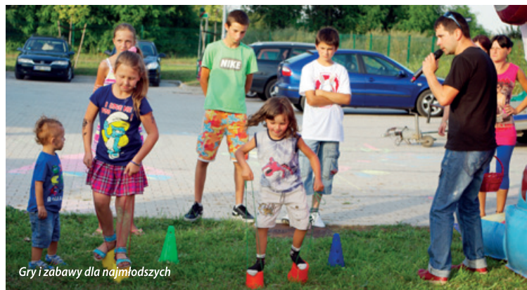
Gry i zabawy dla najmłodszych

zę uatrakcyjnił występ zespołu „Jarzębina”, a zwieńczeniem udanego wieczoru była