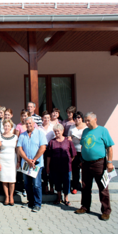
Pamiątkowe zdjęcie uczestników wizyty