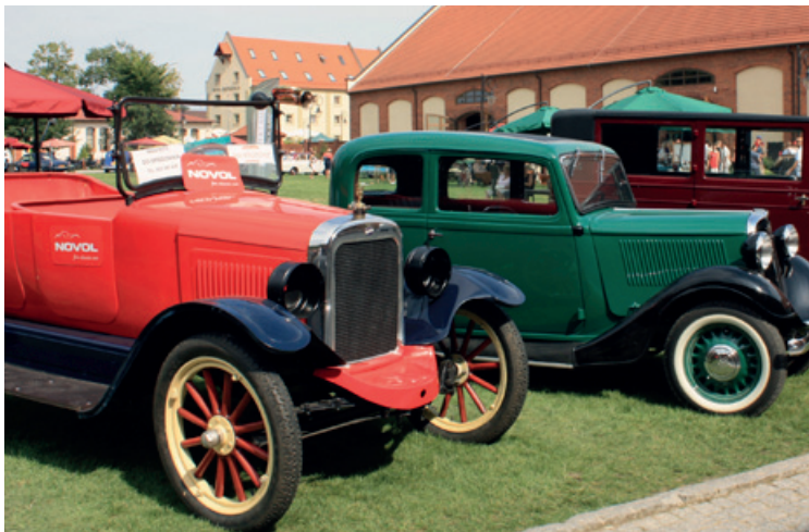
Samochodowe „piękności” w Ślezie

W dniach od 16 do 18 sierpnia 2013 r. na terenie Zamku Topacz, położonym w miejscowości Śleza, odbyła się wyjątkowa, międzynarodowa impreza motoryzacyjna MotoClassic Wrocław 2013. Był to niepowtarzalny zlot, w którym uczestniczyło około 220 zabytkowych pojazdów. W trakcie imprezy można było podziwiać ekspozycje samochodów do roku 1939 oraz z lat 1945 – 1980.