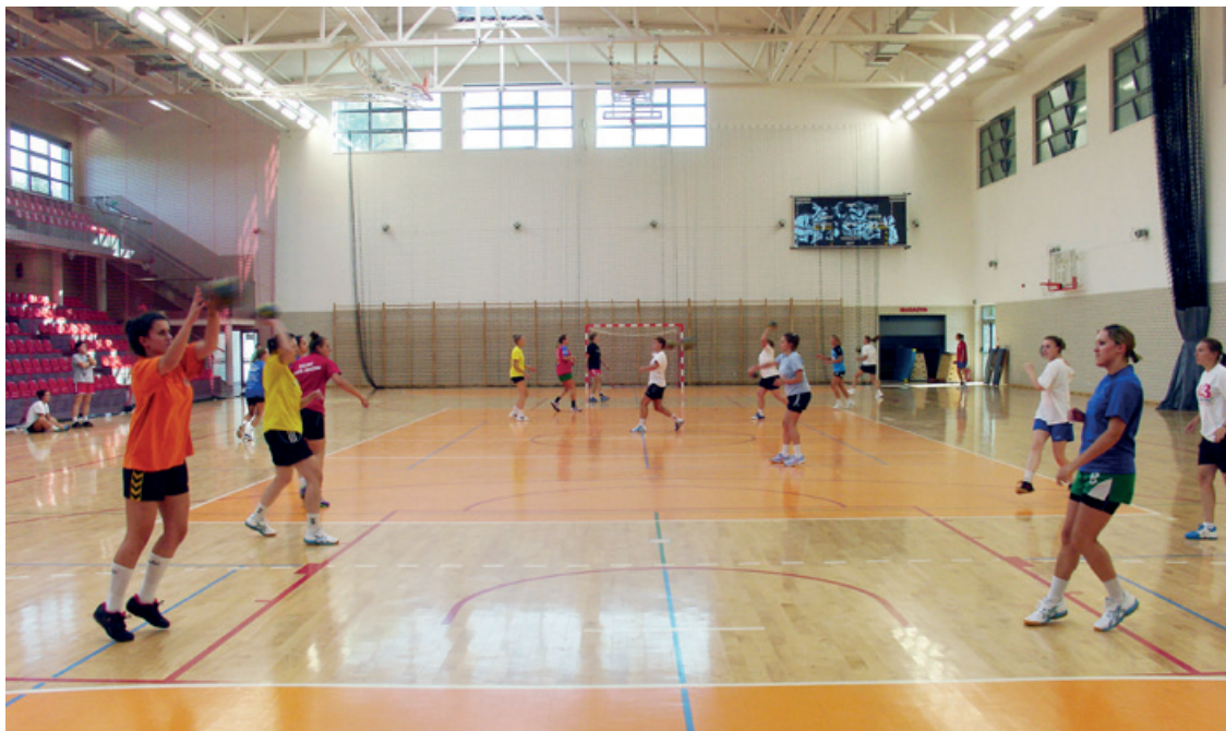
Na treningach nikt się nie oszczędza

Pierwszy mecz ligowy nasi kibice będą mogli obejrzeć dopiero w trzeciej kolejce, 5 października, gdy do Kobierzyca zawita drugi z beniaminków - Dwójka Profil Nowy Sącz. W międzyczasie, w drugiej kolejce - 28 września, nasze zawodniczki czeka kolejny bardzo długi wyjazd do Słupska.