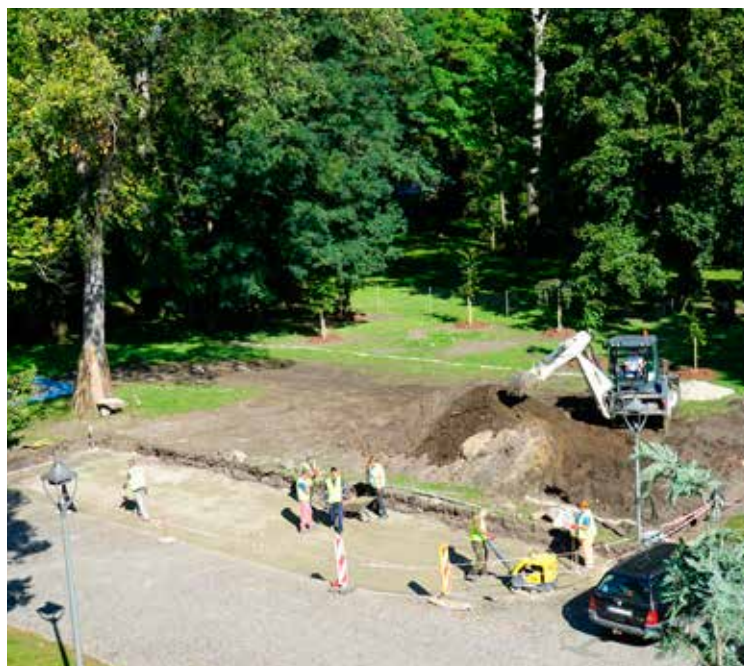
Budowa parkingu przed Urzędem Gminy