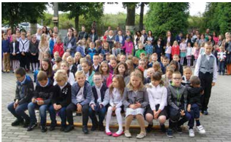
Rozpoczęcie roku szkolnego w Pustkowie Żurawskim