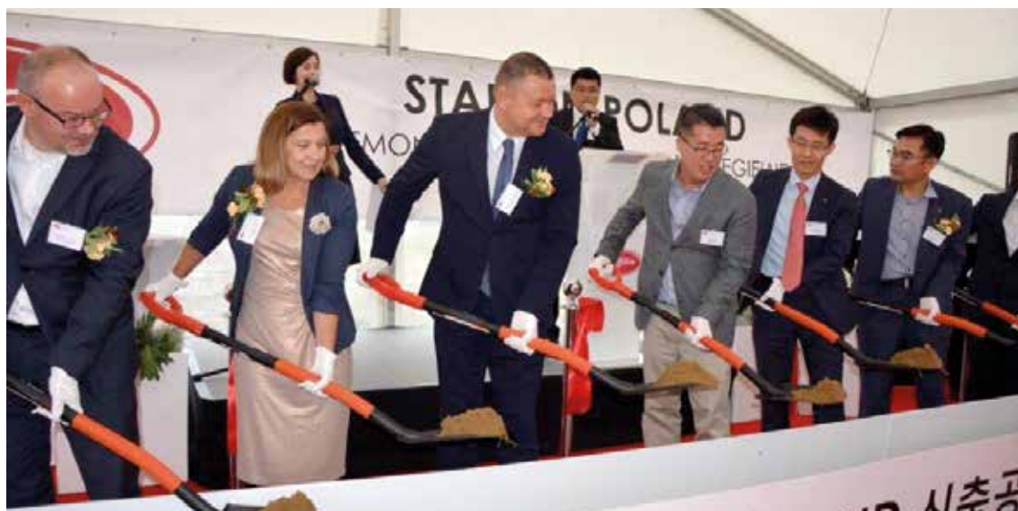
Łopaty w ruch – i można zaczynać budowę

Z wielkim żalem i smutkiem przyjęliśmy wiadomość o śmierci