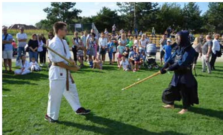
Walkę kendo śledziło wielu widzów

Działania finansowane z budżetu Gminy Kobierzyce