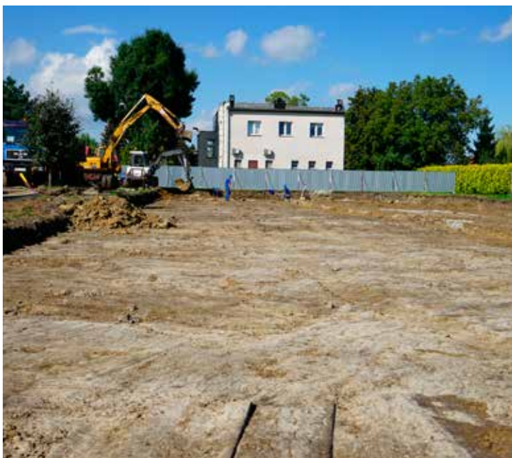
Budowa przedszkola ze żłobkiem w Kobierzycach