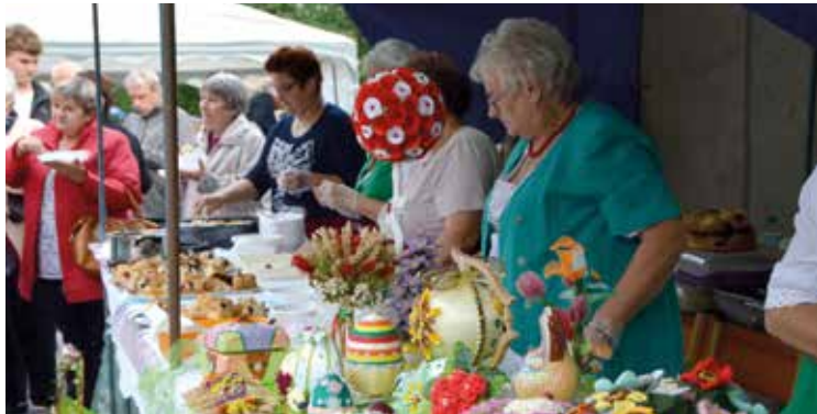
Stoisko Kobierzyckiego Koła Gospodyń było oblegane