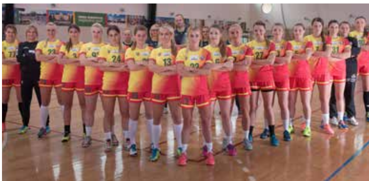
Drużyna KPR Gminy Kobierzyce w pełnej krasie