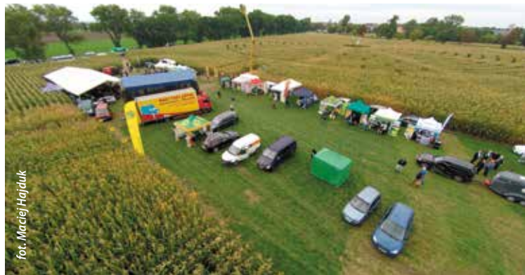
Stoiska w kukurydzy przyciągały zwiedzających