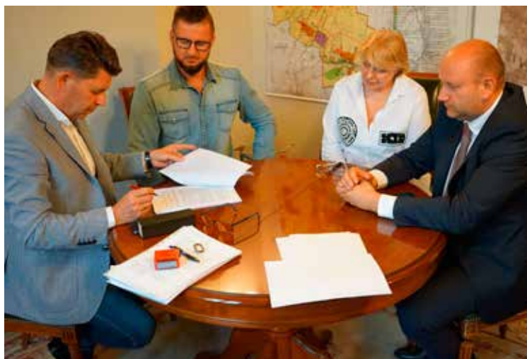
Umowa podpisana – budowę czas zacząć

dwa wydzielone place zabaw, podzielone na grupy wiekowe dla dzieci ze żłobka oraz 3-latków i osobno dla przedszkolaków ze starszych grup wiekowych. W północno-wschodniej części działki pomiędzy projektowanym budynkiem przedszkola