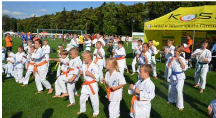
Efektowny pokaz karateków

Nordic Walking – zajęcia polegają na marszu ze specjalnymi kijkami i odbywają się 1 raz w tygodniu. Hala Sportowo-Widowiskowa w Kobierzycach jest miejscem zbiórki.