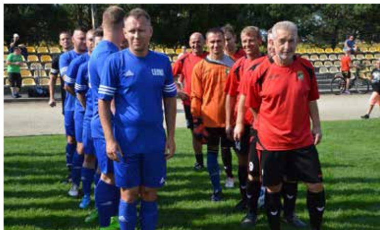
Turniej piłkarski dostarczył sporo emocji