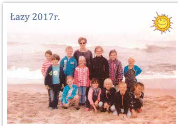
Kolonie w Łazach były udane

Uczestnicy kolonii wiele się nauczyli, zdobyli nowe umiejętności, zobaczyli