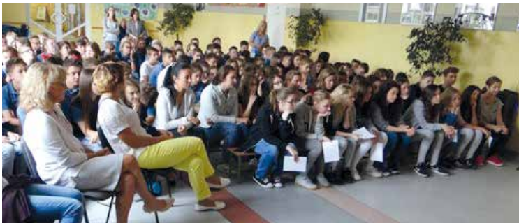
Młodzież szkolna słuchała fragmentów „Quo vadis”