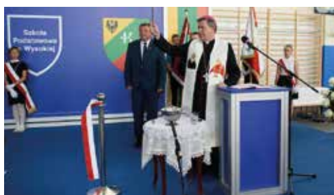
Szkołę poświęcił Arcybiskup Józef Kupny – Metropolita Wrocławski