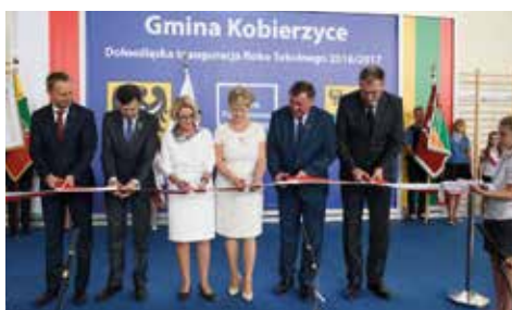
Uroczysty moment przecięcia wstęgi