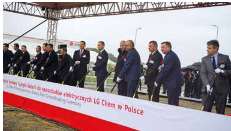
Symboliczne wbicie łopaty