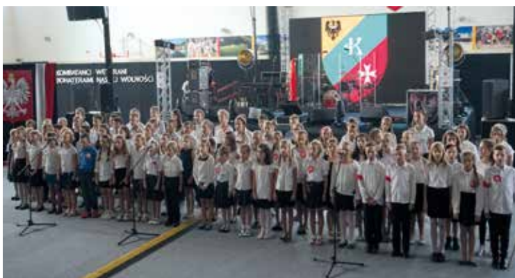
Młodzież szkolna przedstawiła okolicznościowy program artystyczny