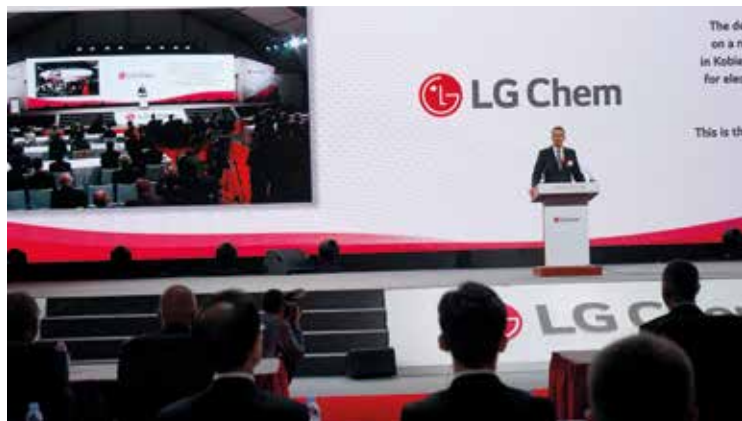
Przemówienie Wicepremiera Mateusza Morawieckiego