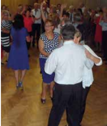
Seniorzy brylowali na parkiecie

Na uroczystości z okazji święta seniorów