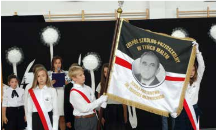
Sztandar z wizerunkiem Premiera Tadeusza Mazowieckiego