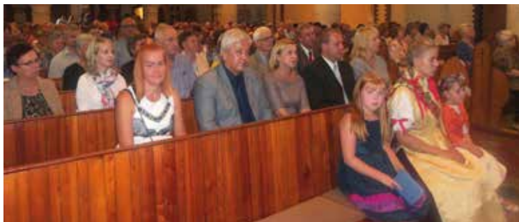
Delegacja z Gminy Kobierzycy w trakcie Mszy Św.