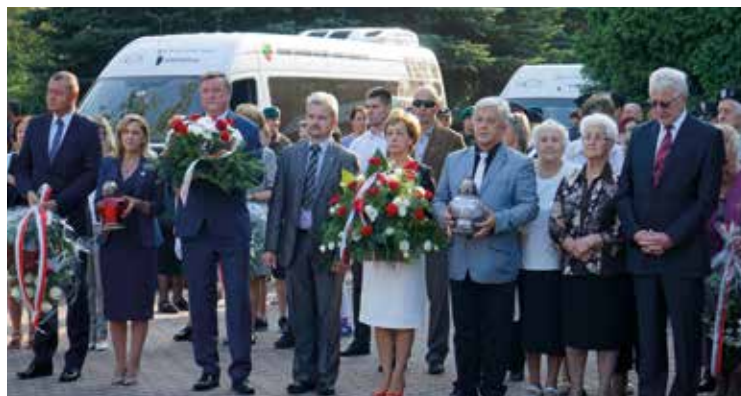
Delegacje złożyły wieńce i znicze przed Obeliskiem ku czci Sybiraków w Koberzycach