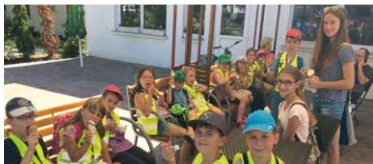
Chętnych na atrakcyjne wycieczki nie brakowało

czas wycieczek. Oczywiście bezpieczeństwo to i pierwsza pomoc, której uczyli dzieci dzielni strażacy z KSRG. Zajęcia odbywały się w siedzibie stowarzyszenia, gdzie czekały na uczestników różne atrakcje – zajęcia plastyczne: rysowanie, malowanie, lepienie z masy solnej, wycinanie, origami; zajęcia kulinarne: smażenie naleśników, wspólne przygotowanie sałatki owocowej, szaszłyków owocowych, ciasta z owocami, deserów lodowych; zajęcia sportowe: piłka nożna, turniej gry w badmintona; zajęcia filmowe – świetlicowe kino oraz różne zajęcia integracyjne: wspólne posiłki i zabawy. Ponadto dzieci chodziły na basen (Ślęza), do kina, odwiedzały wrocławski Park Południowy, ZOO, Sky Tower oraz białski plac zabaw. Pyszne domowe obiady