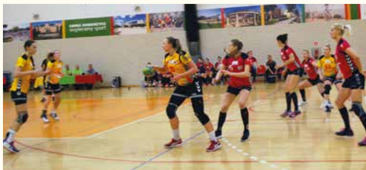
Już z Gdańskiem piłkarki KPR były bliskie wygranej