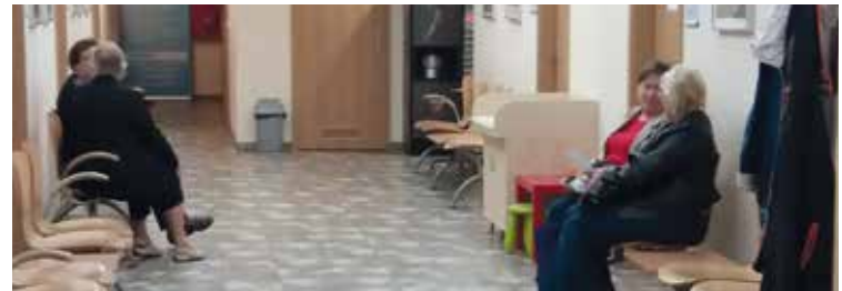
Seniorzy chętnie wzięli udział w badaniach