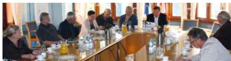
Projekt uchwały przyjęto bez uwag