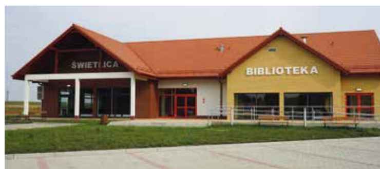
Świetlica z biblioteką w Tyńcu nad Ślężą

wszech miar słuszna. W tych latach wybudowaliśmy 15 nowych świetlic wiejskich, a w istniejących – przeprowadziliśmy kapitalne remonty, które w niektórych przypadkach nie tylko zmieniły bryłę architektoniczną, ale przede wszystkim znacząco podniosły funkcjonalność tych obiektów. Dotyczy to między innymi: Dobkowic, Pustkowa Wilczkowskiego, Bąków czy Domasławia, gdzie właśnie trwa ostatni etap przebudowy. Planujemy ogłoszenie przetargów na budowę świetlic w takich miejscowościach jak: Ślęża, Kuklice, Księginice. W przyszłym roku chcemy rozpocząć projektowanie świetlic w: Krzyżowicach, Żernikach Małych, Nowinach, Żurawicach, Biskupicach Podgórnych (po uzyskaniu gruntu z Agencji Nieruchomości Rolnych – wniosek już został złożony). Tym samym w niedalekiej przyszłości program budowy bądź