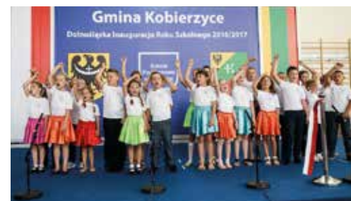
Występy dzieci bardzo się podobały