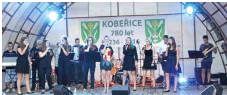
Występ zespołu młodzieżowego GCKiS

przez mieszkańców Cieszyc. Po Mszy Św. wszyscy udali się na plac, na którym odbywały się Dni Kobeřic. Obchody uroczyste rozpoczął Starosta Kobeřic Lukáš