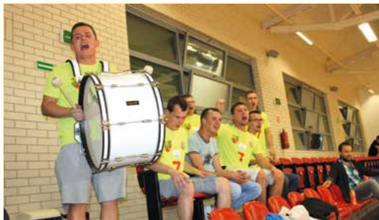
Doping kibiców dodaje sił!