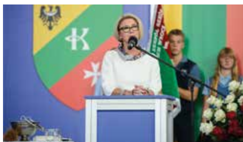
Poseł na Sejm RP Marzena Machałek