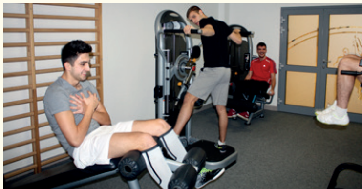
Na sali treningowej