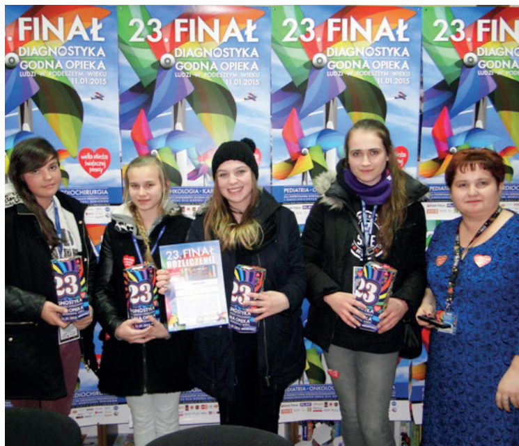
Wolontariuszki WOŚP z Pustkowa Żurawskiego