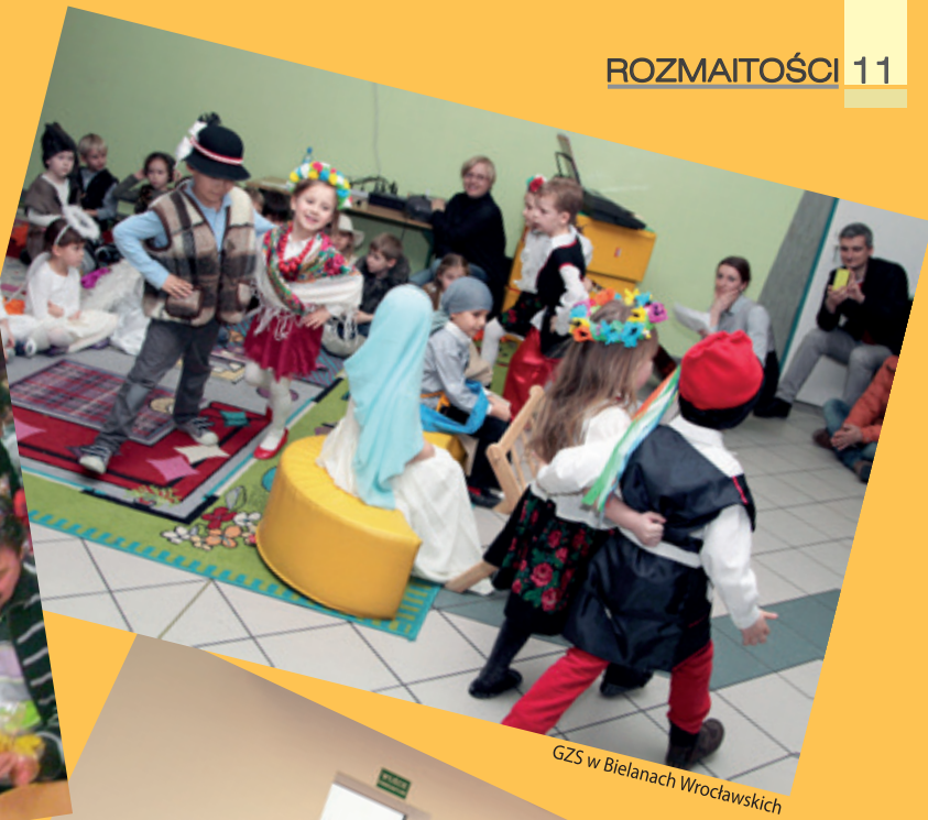
GZS w Bielanych Wrocławskich