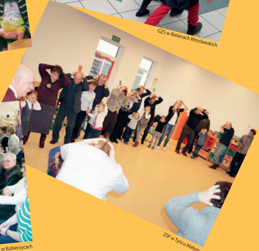
ZSP w Tyrzcu Małym