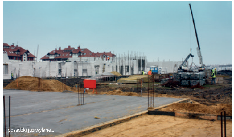
posadzki już wylane...