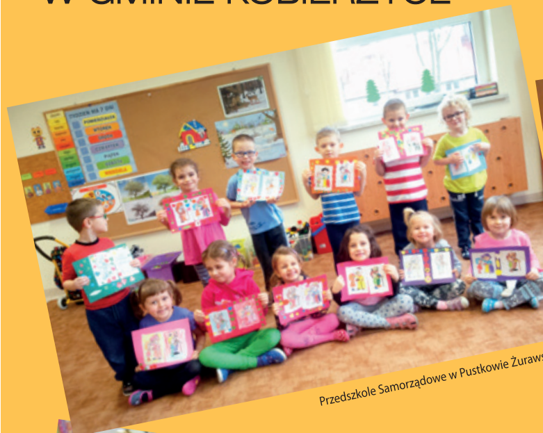
Przedszkole Samorządowe w Pustkowie Żurawskim