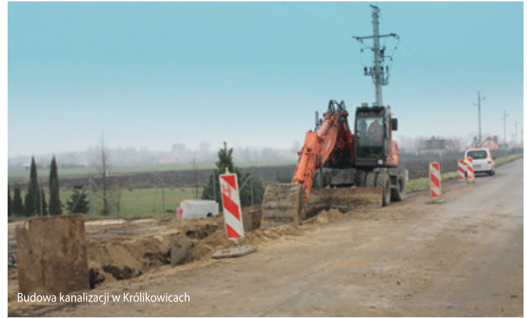
Budowa kanalizacji w Królikowicach