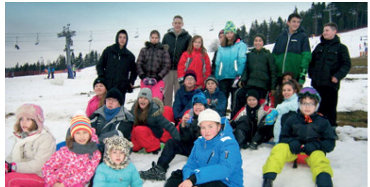
Zimowisko w Zakopanem zorganizowane przez Towarzystwo Przyjaciół Dzieci w Kobierzycach (dofinansowane z budżetu Gminy Kobierzyce)