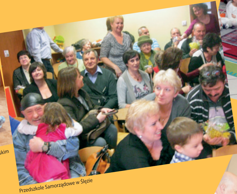
Przedszkole Samorządowe w Ślęzie