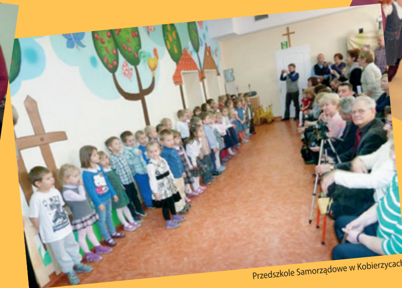
Przedszkole Samorządowe w Kobierzycach