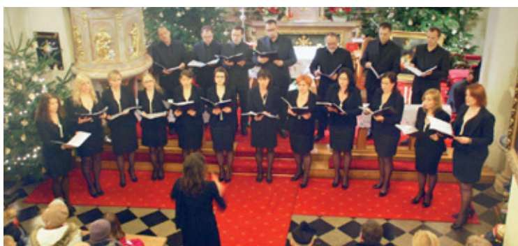
Koncert Chóru Sanctus Andreus

6 stycznia mieliśmy okazję wysłuchać koncertu kolęd w wykonaniu chóru parafialnego Sanctus Andreus z Bielanych Wrocławskich, który już od lat w święto Trzech Króli koncertuje w swoim rodzimym kościele. Tym razem mogliśmy wysłuchać kolęd w języku polskim, a także czeskim, ukraińskim i rumuńskim, które przeplatane ciekawym komentarzem, wprowadziły licznie zgromadzoną publiczność w nastrój zadumy i radości towarzyszący