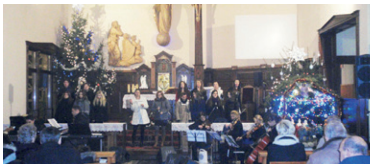
Kolędowanie w kobierzyckim kościele