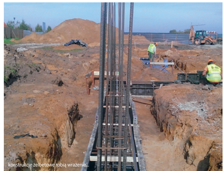
konstrukcje żelbetowe robią wrażenie...