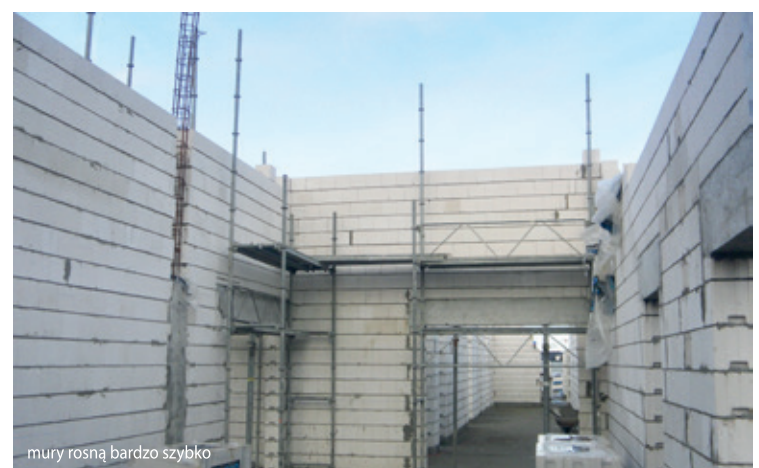
mury rosną bardzo szybko