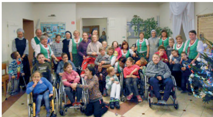
„Tyńczanki” z wizytą w Wierzbicach

W dniu 8 stycznia 2015 roku panie z Koła Gospodyń Wiejskich z Tyńca nad Ślężą odwiedziły z kolędą dzieci przebywające w Zakładzie Opiekuńczo-Lecznym, prowadzonym przez Zgromadzenie Sióstr św. Józefa w Wierzbicach. Dzieci bardzo gorą-