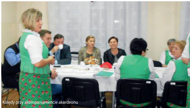
Kolędy przy akompaniamencie akordeonu