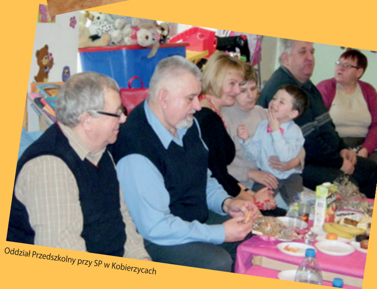
Oddział Przedszkolny przy SP w Kobierzycach