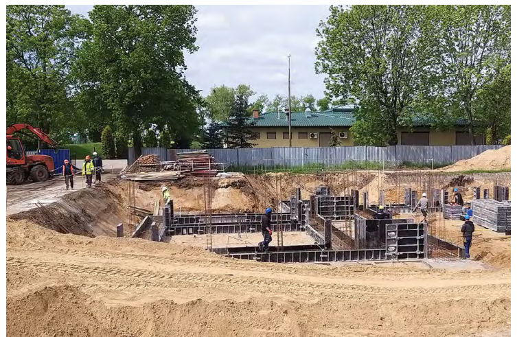
Rozbudowa szkoły w Pustkowie Żurawskim