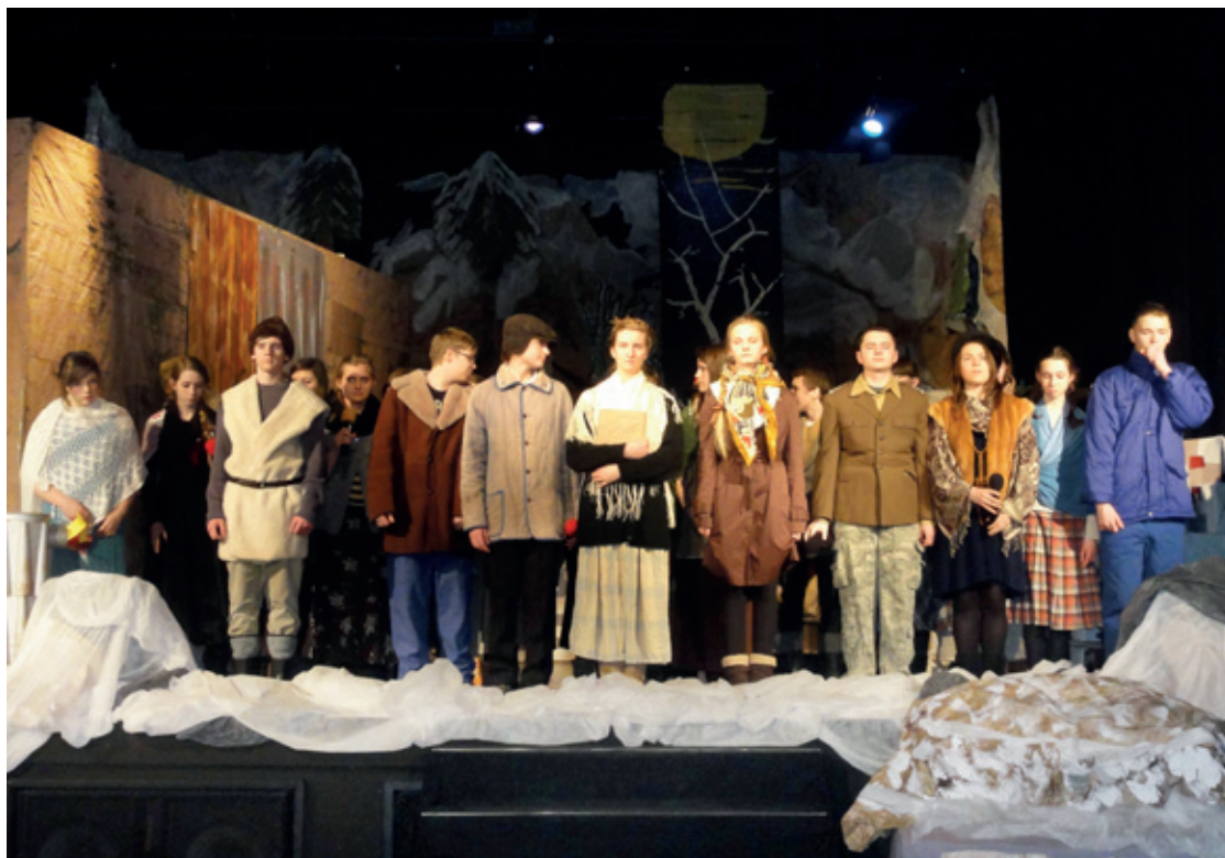
Uczniowie z Kobierzyc na scenie

Dnia 11 kwietnia 2013 roku uczniowie Gimnazjum im. Zesłańców Sybiru z Kobierzyc wystąpili dla środowiska Sybiraków z całej Polski w Klubie 4 Brygady Logistyki we Wrocławiu (dawna sala kina OKO) z widowiskiem „Wagon wspomnień”.