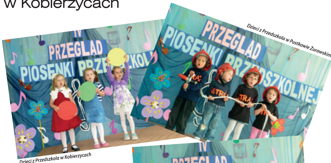
Dzieci z Przedszkola w Kobierzycach