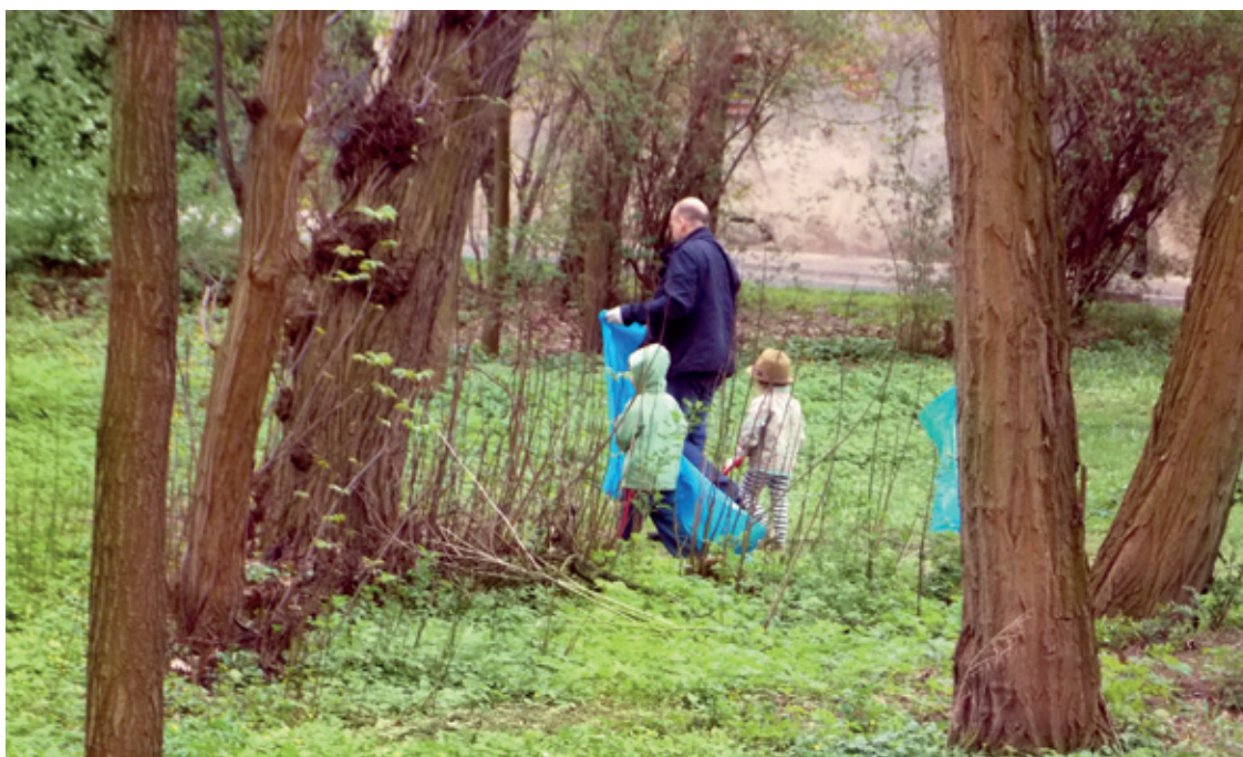
Sprzątali duzi i mali...

Większość plakatów zostało zdjętych, żółte tablice informujące kierowców o ograniczeniu prędkości zostały usunięte z chodników. Ale coś jednak zostało... poczucie, że wspólnie możemy wiele i po raz kolejny to udowodniliśmy! Sprzątanie odbyło się w sobotę 27 kwietnia dzięki dobrej woli i zaangażowaniu wielu mieszkańców naszej miejscowości. Jest to kolejny dowód na to, że niewielkim wysiłkiem można uczynić coś dobrego. Każdy starał się jak mógł, by impreza wypadła jak najlepiej. Jedna osoba zafundowała dmuchany zamek dla dzieci, inna zakupiła wodę mineralną. Ktoś kupił owoce, ktoś inny zrobił gofry, stał przy grillu. Gmina zaopatrzyła nas w worki oraz rękawice. Te większe i mniejsze uczynki sprawiły, że na ustach wszystkich pojawiły się uśmiechy, pomimo niezbyt przychylnej aury. W tym roku zbieranie śmieci nie ograniczało się tylko do tynieckiego parku, ale objęło cały Tyńiec Mały. Kilkuosobowe grupy mieszkańców (tych małych i dużych) ruszyły w teren. Worki zapełniały się bardzo szybko, a efekt końcowy był imponujący. Do naszych perełek można zaliczyć dwa kineskopy telewizyjne, plastikowe akcesoria samochodowe, opony samochodów ciężarowych i osobowych