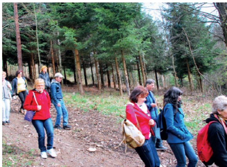
„ISKRA”- Wycieczka w okolicach Międzygórza