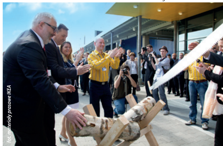
fol. materiały prasowe IKEA