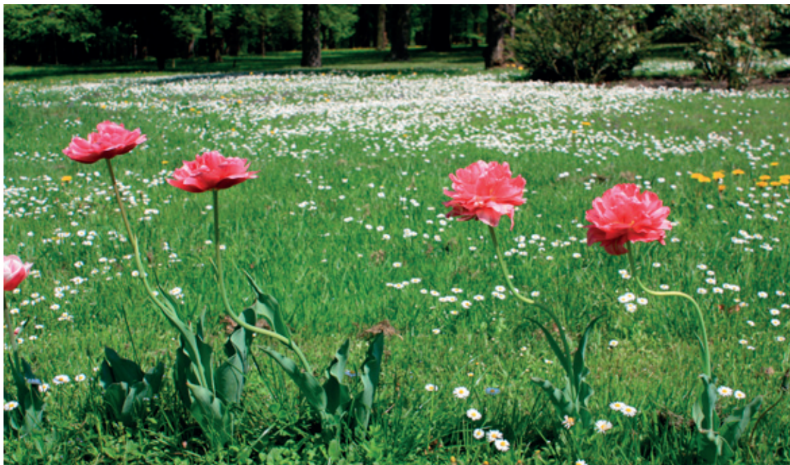
Czystość naszej gminy zależy od każdego z nas!

może być prowadzony ciągle, gdyż aluminium nie traci swoich właściwości.