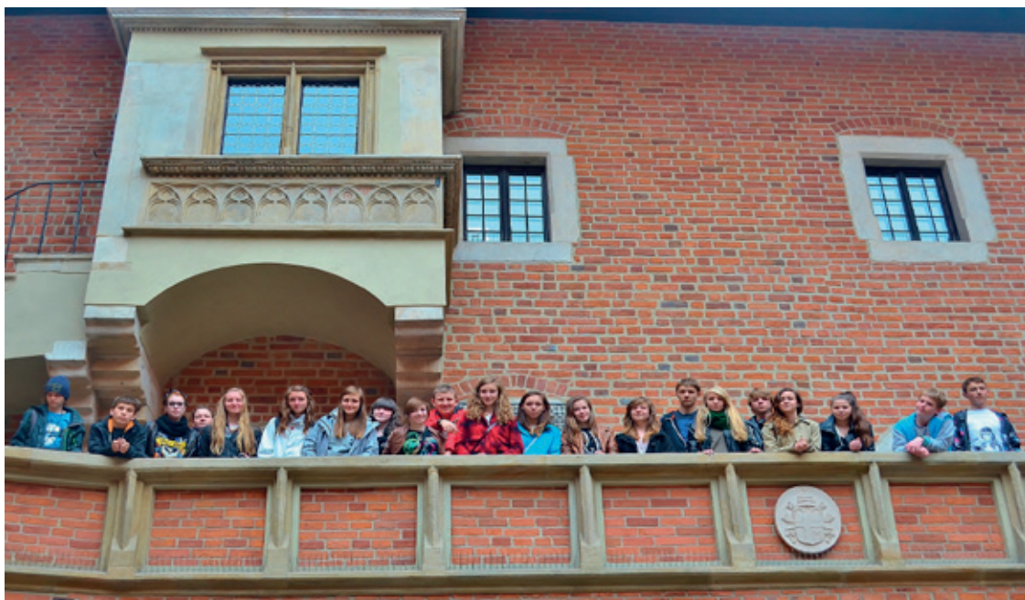
Na wspólnej wycieczce