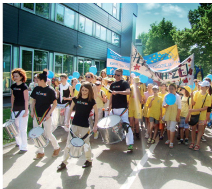
Młodzież z Gminy Kobierzyce w Pochodzie Życia

Już po raz trzeci uczniowie szkół z Kobierzyca i Tyńca Małego poprowadzili Żółty Pochód Życia. Jest to ostatnia duża impreza w ramach Pól Nadziei. Jej idea jest szerzenie idei hospicyjnej. Dzieci maszerują ulicami Wrocławia skandując, śpiewając