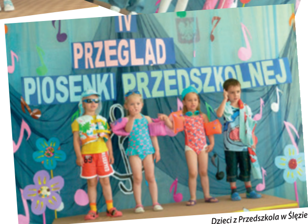
Dzieci z Przedszkola w Ślęzy