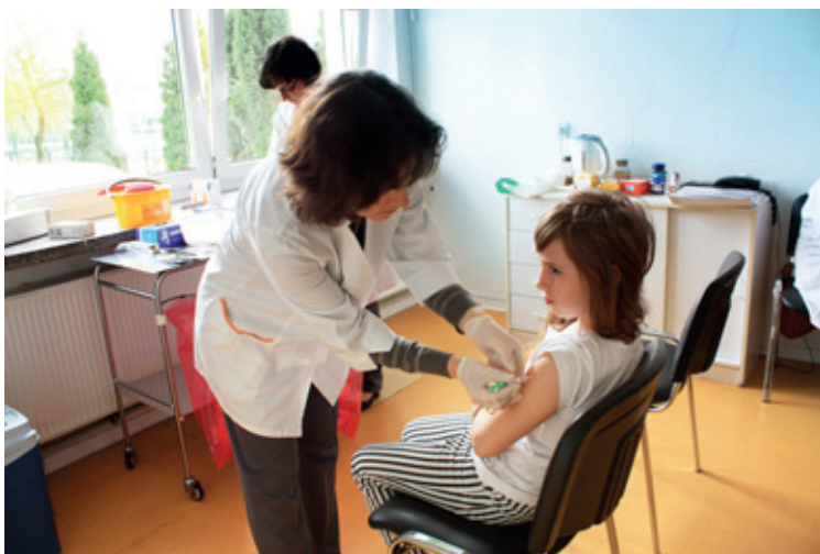
Szczepienia profilaktyczne w Kobierzycach

Profilaktyka jest najskuteczniejszą metodą zapobiegania chorobom – również tym najgroźniejszym. Chorobą, która należy do grupy chorób powodujących wysoką śmiertelność jest rak szyjki macicy. Już po raz szósty odbyły się szczepienia przeciwko rakowi szyjki macicy dziewczynki mieszkających na terenie Gminy Kobierzyce. Szczepione przeciwko wirusowi HPV w kwietniu były uczennice urodzone w 2001 r. Otrzymały one już pierwszą dawkę szczepionki, natomiast druga