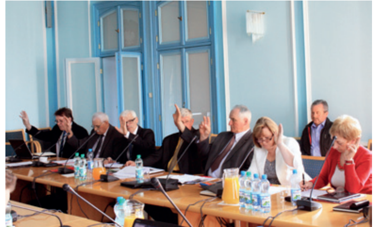
Głosowanie nad kolejną uchwałą

W dniu 26 kwietnia br. w Urzędzie odbyła się XXX Sesja Rady Gminy Kobierzyce. Zostało podjętych 46 uchwał. Radni podjęli uchwały dotyczące sporządzenia planu zagospodarowania przestrzennego dla obszarów położonych między innymi w miejscowości Tyniec Mały, Bielany Wrocławskie, Cieszyce, Tyniec nad Ślę-