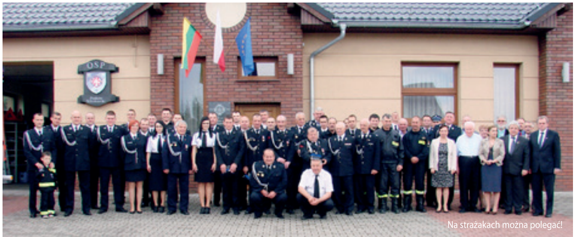
Na strażakach można polegać!

W dniu 1 maja 2014 r. odbyły się obchody 65-cio lecia działalności Ochotniczej Straży Pożarnej w Pustkowie Wilczkowskim. Na uroczystość przybyło wielu znakomych gości.