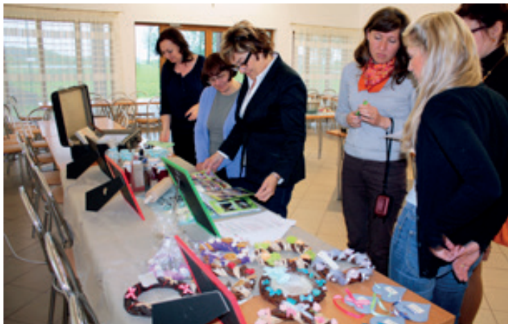
Z wizytą w Chrzanowie