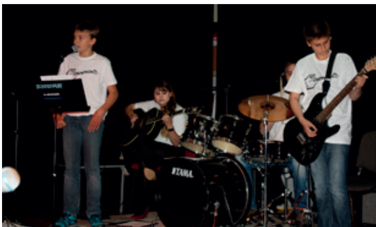
Koncert w Tyńcu Małym