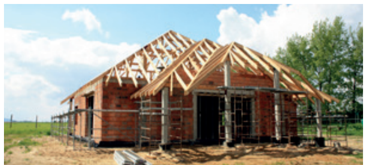
Na budowie świetlicy w Cieszycach