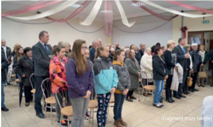
Fragment mszy świętej