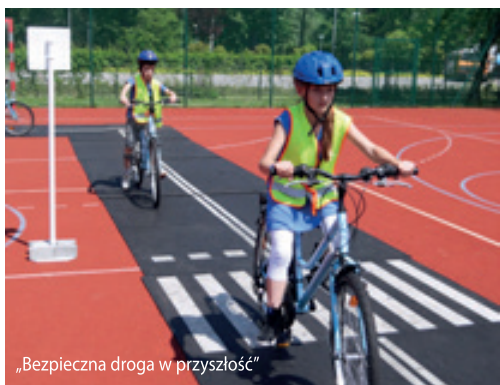
„Bezpieczna droga w przyszłość”

Dbalność o bezpieczeństwo naszych dzieci jest jednym z podstawowych celów szkoły. W dniach 20-23 maja w Szkole Podstawowej w Kobierzycach przeprowadzona została kampania edukacyjna „Bezpieczna droga w przyszłość”. Pracownicy Woje-