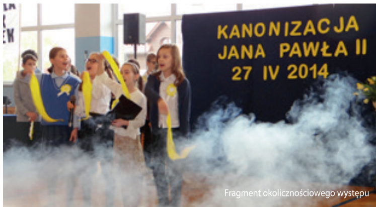
Fragment okolicznościowego występu

Pod takim hasłem dnia 17 kwietnia 2014 r. w Gminnym Zespole Szkół w Bielanych Wrocławskich w związku z kanonizacją Jana Pawła II odbył się uroczysty apel, w którym wzięła udział cała społeczność szkolna. Uroczystość była też zwieńczeniem działań projektowych uczniów szkoły podstawowej i gimnazjum oraz wspomagających ich nauczycieli. W ramach projektu uczniowie obejrzyli film pt. „Człowiek, który zmienił świat”, zapoznali się z treścią listu Papieża skierowanego do dzieci, uczestniczyli w konkursach plastycznym i recytatorskim. Uczniowie klas 0-3 przygotowali prace na temat: „Papież oczami dzieci”, klas 4-6 - „Jan Paweł II - Papież Polak”. Najciekawsze prace uczniów zostały wyeksponowane na wystawie