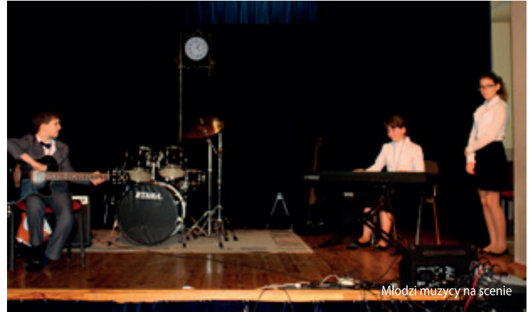
Młodzi muzycy na scenie