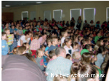
Nie było wolnych miejsc

26 kwietnia 2014 roku miało miejsce drugie przedstawienie teatralne dla dzieci w Świątlicy Bielańskiej. Tym razem wystawialiśmy „Dr Dollittle i jego zwierzęta”. Frekwencja przeszła wszelkie oczekiwania. Przedstawienie bardzo się podobało, a gromkie brawa dla aktorów od dzieci i rodziców były podziękowaniem za wspólny spektakl i miłą rodzinną atmosferę. Dziękuję wszystkim, którzy pomagali