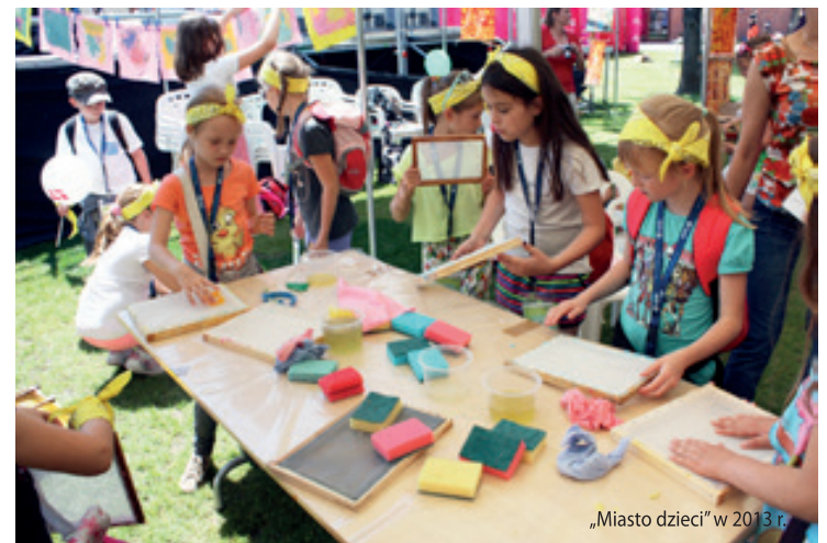
„Miasto dzieci” w 2013 r.