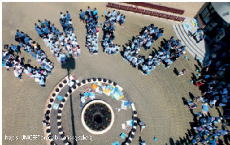
Napis „UNICEF” przed bielańską szkołą

Piąta rocznica nadania Szkole Podstawowej i Gimnazjum imienia UNICEF obchodzona była w dniach 22-23 maja 2014 r. To wydarzenie zbiegło się z 25 rocznicą przyjęcia międzynarodowej Konwencji Praw Dziecka - będącą najważniejszym międzynarodowym dokumentem poświęconym prawom dziecka. Z wielką przyjemnością gościliśmy w naszej szkole uczniów, nauczycieli i dyrektorów z dziewięciu szkół o tym samym imieniu. Podczas pierwszego dnia zjazdu mieliśmy okazję poznać różne pomysły związane z propagowaniem idei naszego patrona. Wspólnym elementem prezentacji okazały się akcje i działania charytatywne proponowane przez UNICEF, których celem było niesienie pomocy potrzebującym zarówno w naszym kraju, jak i za granicą. Wszystkie te działania sprzyjały budzeniu w dzieciach i młodzieży wrażliwości i troski o innych. Zjazd szkół o imieniu UNICEF sprzyjać miał