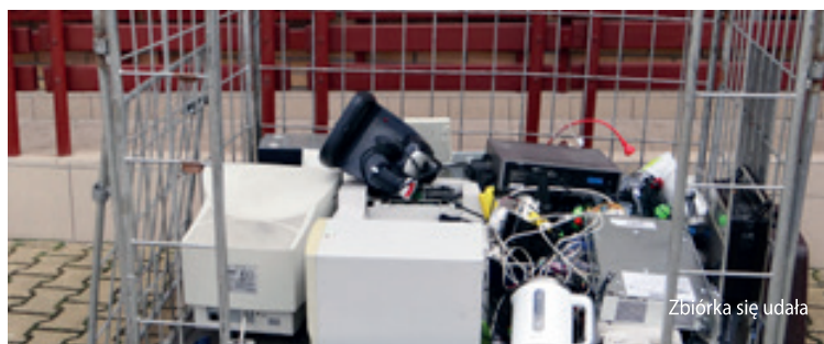
Zbiórka się udała

a także odpowiedniej segregacji, surowce trafiły do właściwych kontenerów. Klasy, którym udało się zebrać najwięcej materiałów, otrzymały punkty w szkolnym konkursie Liga Zadaniowa. Podczas zbiórki obecny był przedstawiciel firmy Cargill Starches and Sweeteners Europe, który przekazał naszej szkole sadzonki kwiatów. Warto podkreślić, że w akcję zaangażowali się także rodzice oraz najmłodszy uczniowie z klas 0-3, którym serdecznie dziękujemy. Zebrano znaczną ilość odpadów, które spełniły wymagane kryteria, a uczniowie naszej szkoły po raz kolejny pokazali, że