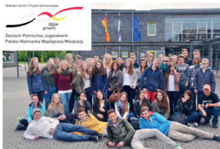
Pamiątkowe zdjęcie uczestników wycieczki

W dniach od 6 do 14 maja 2014 r. dwudziestu uczniów z Gimnazjum im. Żesłańców Sybiru w Kobierzycach wyjechało do Stadtlohn w Niemczech w ramach wymiany uczniowskiej, wspieranej finansowo przez międzynarodową organizację: Polsko-Niemiecką Współpracę Młodzieży. W ciągu tych dni zwiedzili oni piękne miejsca w Niemczech i Holandii. Na początku zobaczyli Haarlem ze swoją malowniczą starówką, pięknym kościołem oraz nadmorski kurort w Egmont aan Zee. Następnie pojechali do Bochum by zwiedzić muzeum górnictwa. Kolejnym punktem była wystawa światła i dźwięku