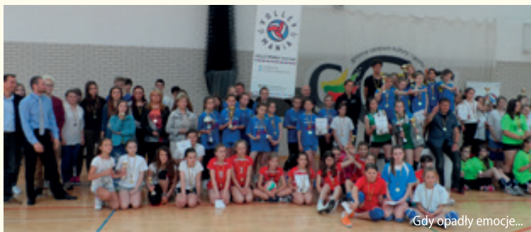
Gdy opadły emocje...