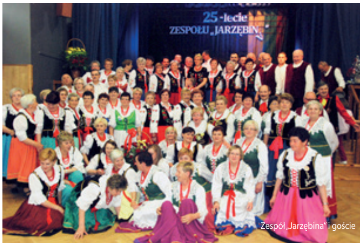
Zespół „Jarzębina” i goście

Zespół muzyczny „Jarzębina” z Kobierzycy, to jeden z kilku zespołów propagujących śpiewanie w naszej gminie. Dla członków zespołu śpiewanie jest czymś więcej niż tylko przygodą związaną z występami. Muzykowanie i cotygodniowe spotkania, to pretekst dla ludzi chcących się wyrwać z domu, to obowiązek i chęć uczestniczenia w życiu społecznym.