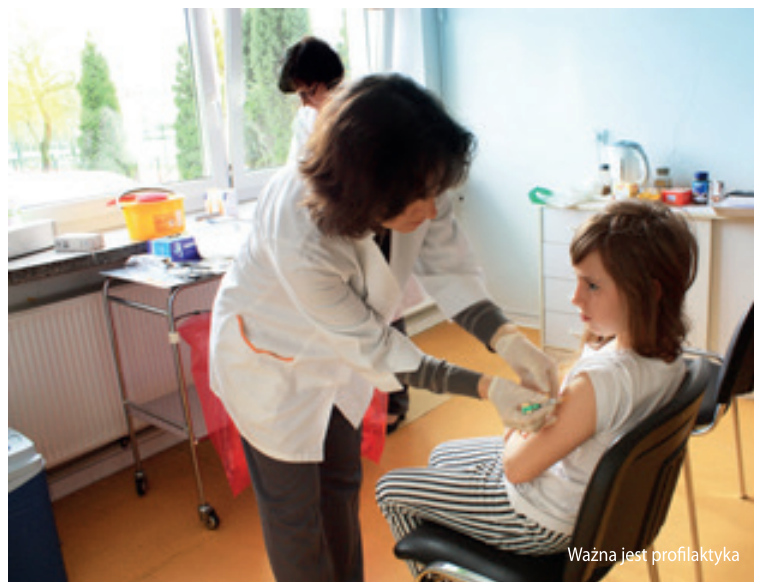
Ważna jest profilaktyka

Działanie finansowane z budżetu Gminy Kobierzyce