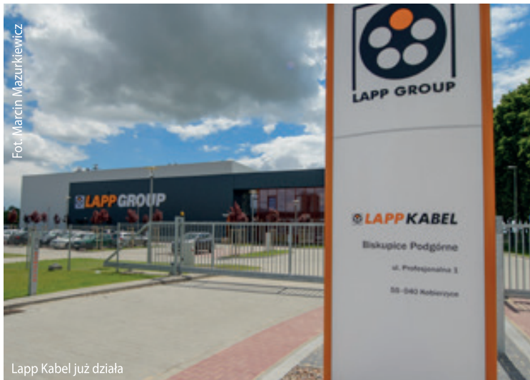
Lapp Kabel już działa

15 maja 2014 roku na terenie Tarnobrzelskiej Specjalnej Strefy Ekonomicznej Podstrefa Wrocław – Kobierzyce w Biskupicach Podgórnych odbyło się oficjalne otwarcie Lapp Kabel. Firma jest jednym z głównych dostawców kabli i akcesoriów kablowych na świecie.