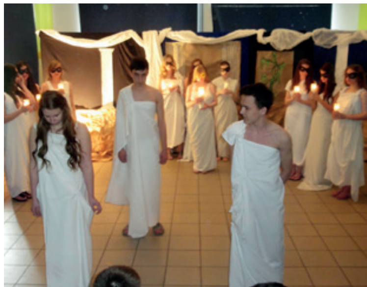
„Antygona” w kobierzycyjskiej szkole

Wielka powtórka z lektur przed egzaminami dla klas trzecich. Edukacja, humor i zabawa - to zadania projektu „Lekturalia gimnazjalne”. Przez kilka miesięcy trzecioklasiści z gimnazjum im. Zesłańców Sybiru w Kobierzycach, na zajęciach artystycznych ciężko pracowali ucząc się ról, ruchu scenicznego, szyjąc stroje, opracowując scenografię. Środa - 16 kwietnia, była dniem podsumowującym przedsięwzięcie. Całość opierała się na inscenizacji wybranych lektur. Na scenie pojawiła się „Zemsta” Aleksandra Fredry w wykonaniu klasy IIIE, „Skąpiec” Moliera, którego przygotowała klasa IIIB, „Antygona” Sofoklesa pokazana przez klasę IIIA, „Romeo i Julia” Williama Shakespeare’a w wykonaniu klasy IIID oraz „Dziady” Adama Mickiewicza w inscenizacji klasy IIIC.