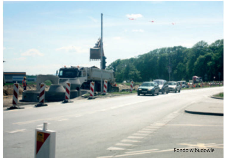
Rondo w budowie