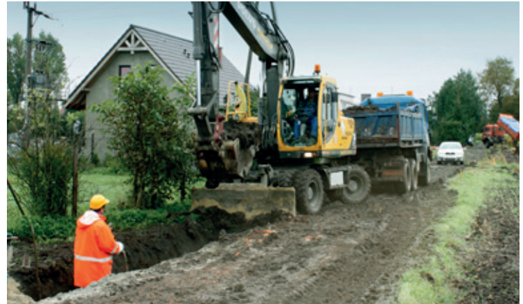
Prace przy budowie kanalizacji w toku

W dniu 4 grudnia 2013 r. zostały podpisane z Wojewódzkim Funduszem Ochrony Środowiska we Wrocławiu aneksy do umów o dofinansowanie zadania pn. „Budowa kanalizacji sanitarnej dla części południowej Gminy Kobierzyce”. Tym samym zwiększyło się dofinansowanie jakie WFOŚ i GW przyznał w 2010 r. gminie w formie pożyczki i wynosi ona 7 344 700 zł. oraz bezzwrotnej dotacji tj. 3 672 300 zł. Prace budowlane są realizowane od września 2010 r. i obejmują miejscowości: Żurawice,