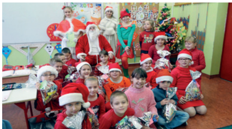
Mikołaj w Szkole Podstawowej w Kobierzycach