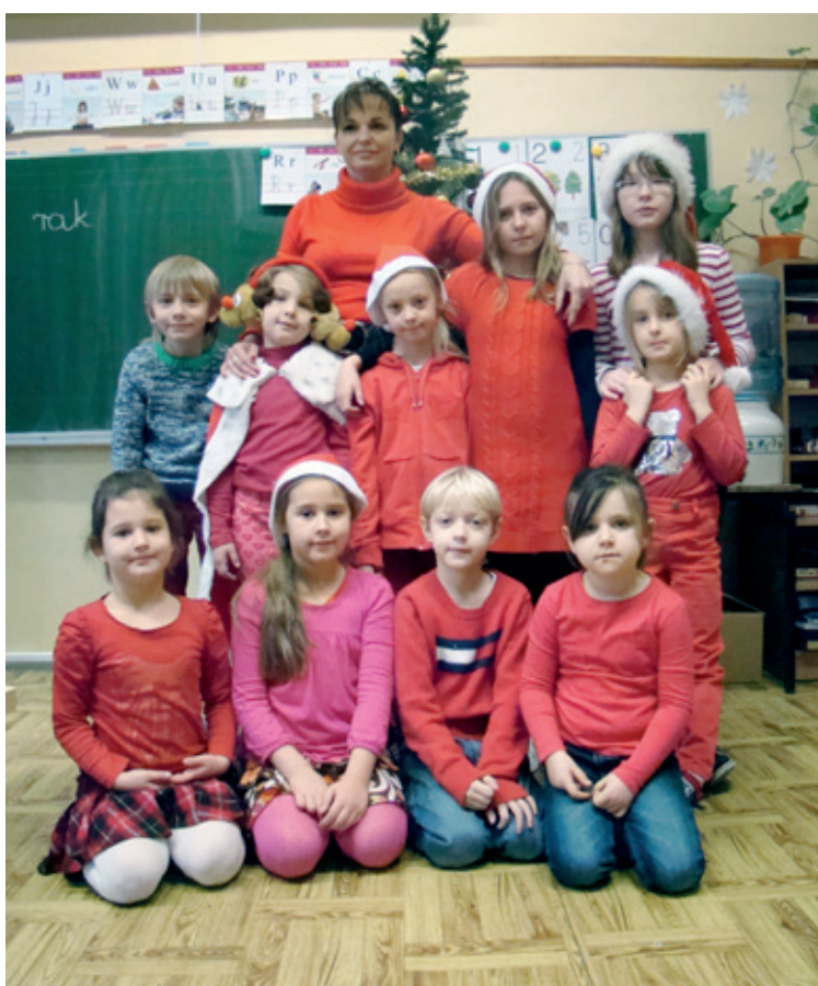
Mikołajki w Szkole Podstawowej w Tyńcu Małym

6 grudnia 2013 r. we wszystkich szkołach i przedszkolach odwiedził dzieci Św. Mikołaj. Szczególnie wyczekiwany przez najmłodszych, przyniósł wiele prezentów, którymi obdarował dzieci. Na powitanie Gościa uczniowie przygotowali program artystyczny, w tym piosenki, zabawy oraz słodki poczęstunek. W świątecznej scenerii Mikołaj bawił się i tańczył wraz z dziećmi. Wśród piosenek o Mikołaju znalazły się m.in.: „Siedem reniferów”, „Jedzie Mikołaj”, „A Mikołaj pędzi, a Mikołaj gna”. Wspólne tańce dodawały jeszcze bardziej radosnego nastroju, szczególnie w rytmie