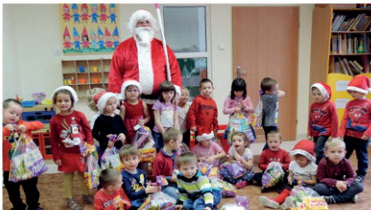
Mikołaj w Zespole Szkolno-Przedszkolnym w Pustkowie Żurawskim