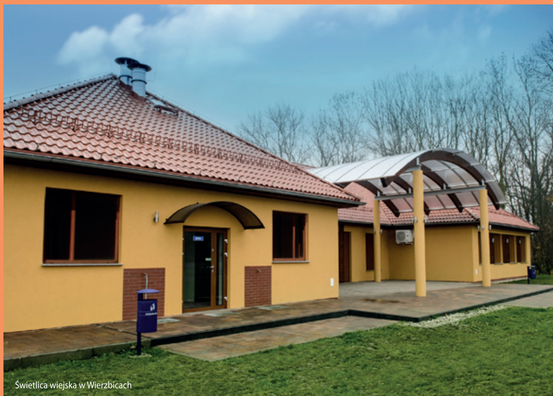
Świetlica wiejska w Wierzbicach

- Czy w tym czasie powstały w naszej gminie jakieś inne budynki użyteczno-