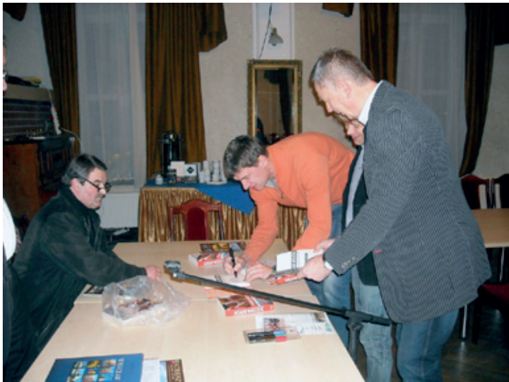
Adam Wójcik podpisuje książki