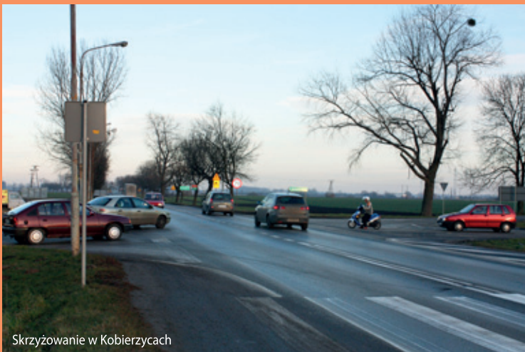
Skrzyżowanie w Kobierzycach