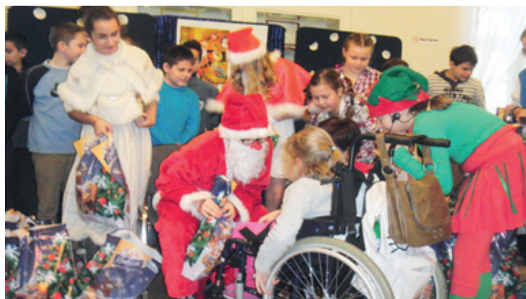
Mikołaj w ZSS w Wierzbicach