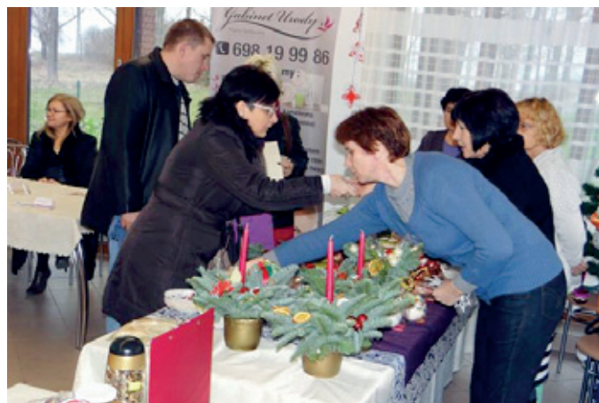
Na kiermaszu w Chrzanowie