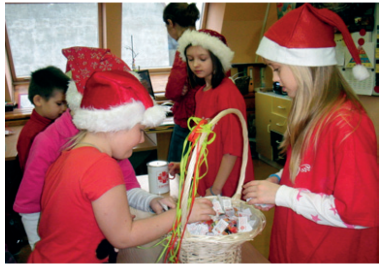
Wolontariuszki w akcji

6 grudnia Szkolne Koło Caritas przeprowadziło na terenie naszej szkoły zbiórkę „Złotówka dla Św. Mikołaja”. W ten sposób włączyliśmy się w coroczną akcję charyta-