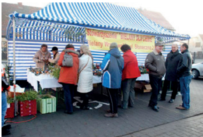
Na kiermaszu w Bielanych Wrocławskich

15 grudnia w Bielanych Wrocławskich na parkingu obok kościoła odbył się kiermasz bożonarodzeniowy zorganizowany przez członków Stowarzyszenia „Bielany dla Ciebie”. Uzyskany dochód z kiermaszu będzie wkładem finansowym mieszkańców w remont budynku starej szkoły przy ul. Słonecznej 2, w którym mieści się siedziba stowarzyszenia oraz na potrzeby lokalnej społeczności, sali spotkań, biblioteki, kawiarenki. Prace związane z przygotowaniem kiermaszu, trwające już od listopada 2013 r. ujawniły wiele artystycznych talentów, integrowały mieszkańców naszej miejscowości którzy brali czynny udział w pracach, ale byli też tacy, którzy przychodzili tylko potowarzyszyć. Prace porządkowe w budynku prowadzono już od wiosny bieżącego roku. Zaprowadzony ład i porządek pozwolił na zagospodarowanie pomieszczenia, w którym odbywały