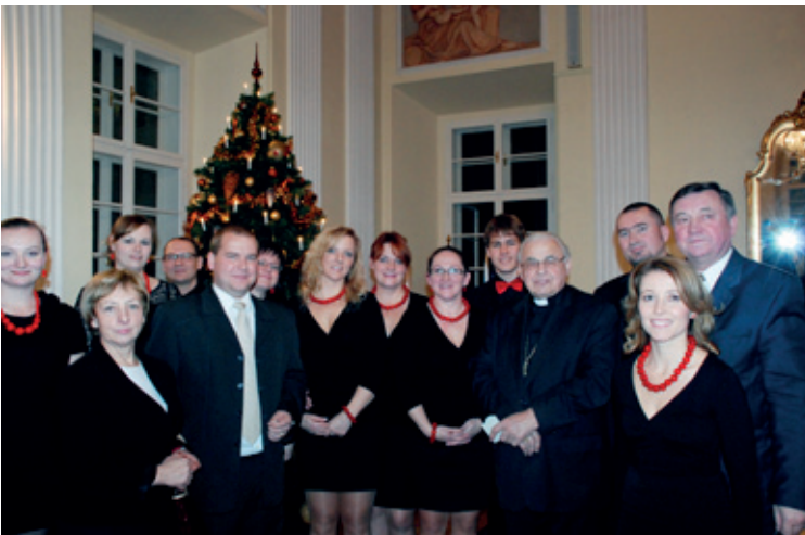
Uczestnicy spotkania na pamiątkowym zdjęciu