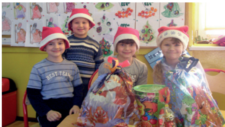
Mikołaj w Szkole Podstawowej w Pustkowie Wilczkowskim