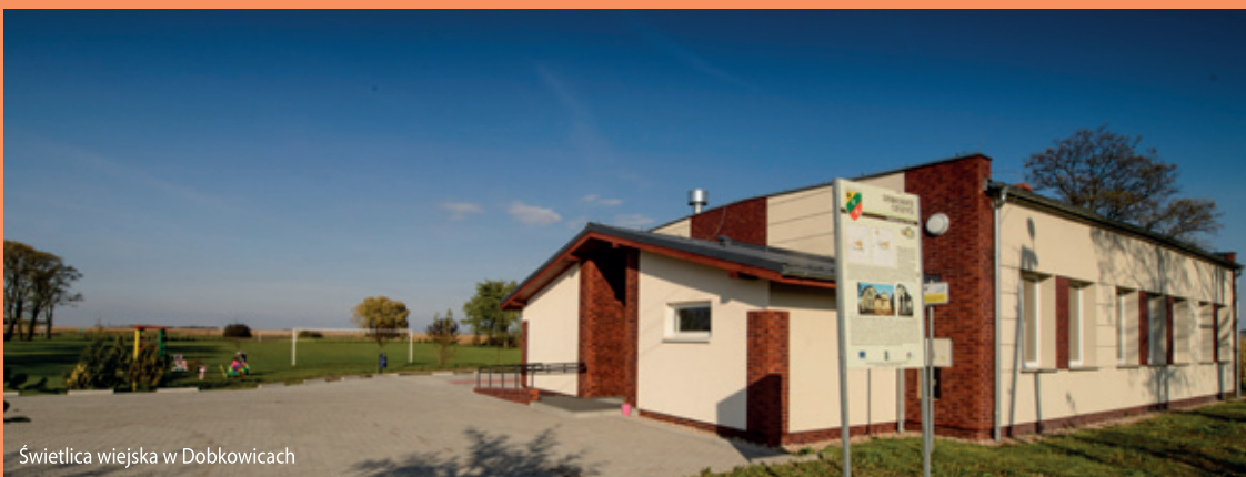
Świetlica wiejska w Dobkowicach

Należy w tym miejscu wspomnieć, co nam się wspólnie z inwestorami z terenu Gminy Kobierzyce udało osiągnąć. Powstanie AOW i obwodnicy Tyńca Małego jest tego najlepszym przykładem. Liczymy, że również i w przypadkach, które poruszyliśmy powyżej, doczekamy się szczęśliwego zakończenia. Niestety z chwilą oddania do użytku AOW, na Gminę Kobierzyce spadły koszty utrzymania i zarządzania w pełnym zakresie odcinkami byłych dróg krajowych: z Małuszowa do ronda za Tyńcem Małym oraz drogi z Magnic przez Domaśław i Bielany Wrocławskie do autostrady A4. Wiąże się to oczywiście z dużymi kosztami remontów i bieżącego utrzymania (koszenie traw, odśnieżanie itp.).