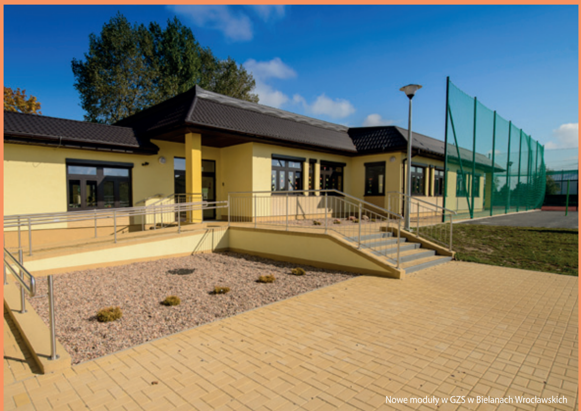
Nowe moduły w GZS w Bielanych Wrocławskich