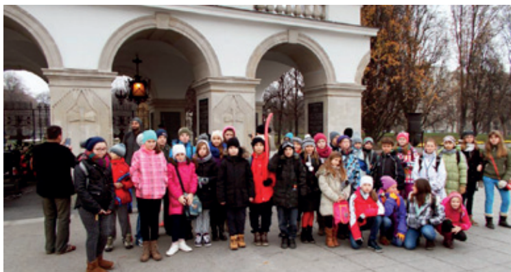
Uczniowie z Pustkowa Żurawskiego w Warszawie