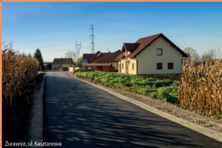
Żurawice, ul. Kasztanowa