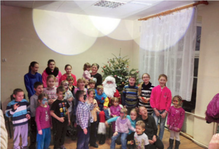
Pamiątkowe zdjęcie z Mikołajem