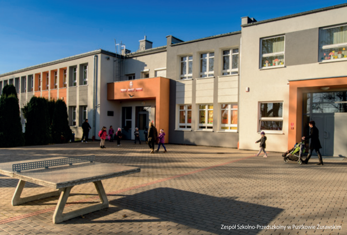
Zespół Szkolno-Przedszkolny w Pustkowie Żurawskim

Tradycyjnie pod koniec każdego roku kalendarzowego na łamach biuletynu samorządowego „Moja Gmina-Moja Wieś” dokonujemy przeglądu najważniejszych inwestycji, rozpoczętych lub zakończonych w Gminie Kobierzyce: