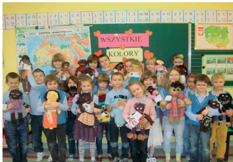
Mali uczestnicy projektu ze swoimi laleczkami

Projekt edukacyjny „Wszystkie Kolory Świata” został zainspirowany przez Polski Komitet Narodowy UNICEF. Uczniowie wraz z rodzicami, dziadkami lub nauczycielami przygotowali charytatywne laleczki, które sprzedano na specjalnych spotkaniach szkolnych. Zostały one zorganizowane przez wychowawców klas 0-6, a uczestnikami byli uczniowie i ich rodziny. Spotkania te były niezwykle okazją do obejrzenia przygotowanych laleczek, którym nadano tożsamość i wypisano „akty urodzenia”. Uczniowie zabrali widzów w niecodzienną podróż przez kontynenty, państwa i miejscowości, w których „urodziły się” ich laleczki. Swoją postawą i zaangażowaniem zachęcali dorosłych do zakupu laleczki, by w ten sposób wsparli akcję pomocy dla dzieci w Czadzie organizowaną przez UNICEF. Projekt realizowany w terminie 7 stycznia 2013 r. - 28 lutego 2013 r. pozwolił na realizację idei patrona szkoły – rozwijanie wrażliwości społecznej i niesienie pomocy najbar-