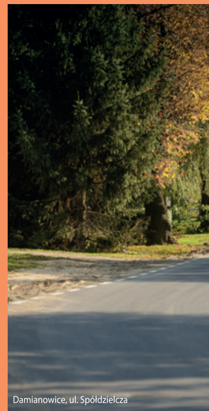
Damianowice, ul. Spółdzielcza