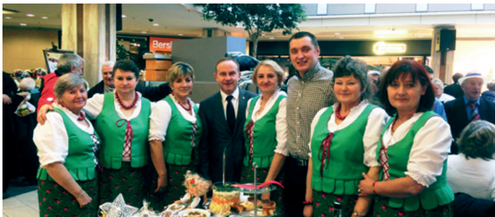
Pamiątkowe zdjęcie w „Pasażu Grunwaldzkim”

14 grudnia w „Pasażu Grunwaldzkim” we Wrocławiu odbyła się wystawa stołów wigilijnych, której organizatorami byli m.in. Urząd Marszałkowski Województwa Dolnośląskiego wraz z Dolnośląskim Ośrodkiem Doradztwa Rolniczego. W wystawie wzięło udział 26 stołów, które przygotowały Koła Gospodyń Wiejskich z Dolnego Śląska. W tym roku Koło Gospodyń Wiejskich z Tyńca nad Ślężą miało zaszczyt reprezentować Gminę Kobierzyce. Nasze panie bardzo starannie i z wdziękiem przygotowały wszystkie wigilijne potrawy oraz ozdoby, a efekt ich pracy wypadł bardzo okazale. Podczas wystawy odbywały się również występy zespołów ludowych, które śpiewając kolędy wprowadziły wszystkich w świąteczny nastrój.