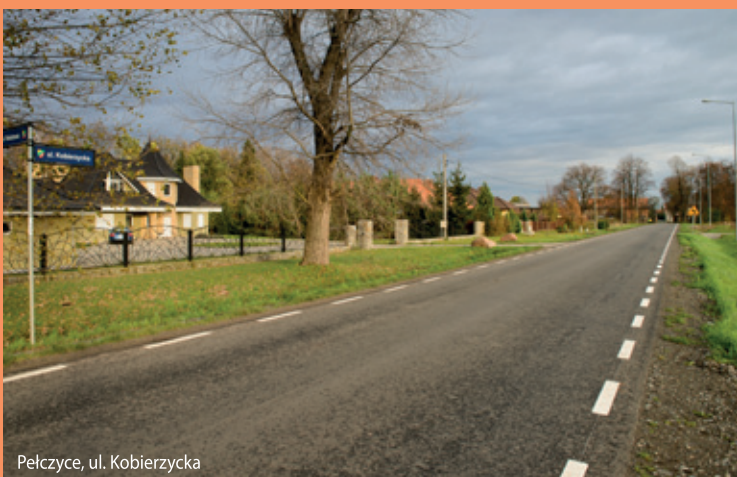
Pełczyce, ul. Kobierzycza