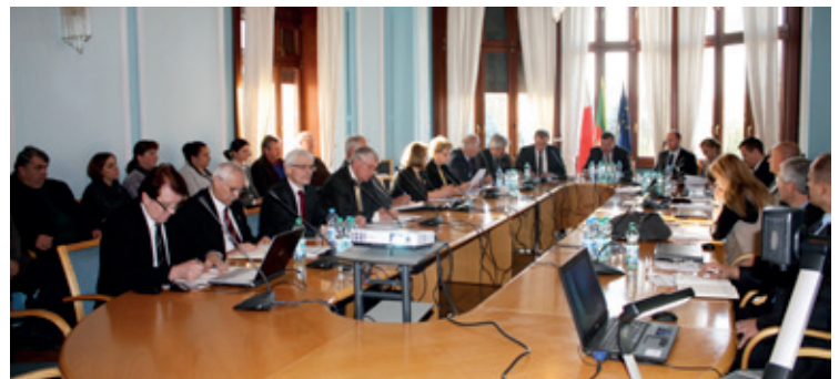
Na sali obrad

29 listopada 2013 r. w Urzędzie Gminy Kobierzyce miała miejsce XXXV sesja Rady Gminy Kobierzyce. Tradycyjnie sesja rozpoczęła się przyjęciem protokołu z XXXIV sesji, informacjami Przewodniczącego Rady o działaniach podejmowanych w okresie międzysesyjnym oraz sprawozdaniem Wójta z bieżącej działalności. Radni w trakcie obrad podjęli 14 uchwał. Część z uchwał dotyczyła przystąpienia do sporządzenia miejscowego planu zagospodarowania przestrzennego m.in. takich obszarów jak: wschodnia część ob-