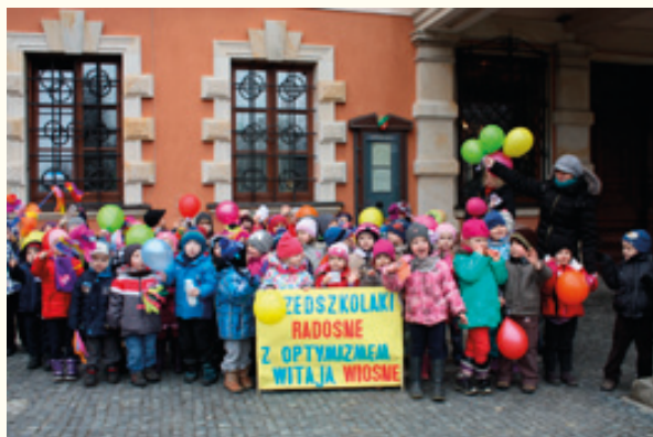
Przedszkole w Kobierzycach

21 marca, pomimo niesprzyjającej aury, przedszkolaki, dzieci i młodzież szkolna z Gminy Kobierzyce świętowali ten wyjątkowy dzień - kolorowo przywoływali wiosnę.