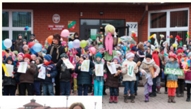
SP w Kobierzycach