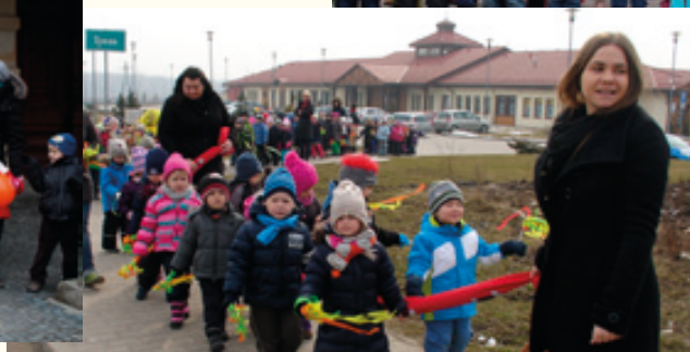
Przedszkole w Ślężie