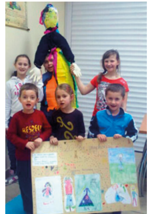
Zajęcia dla dzieci w świetlicy w Szczepankowicach

Świetlica ma dla wsi ogromne znaczenie - jest miejscem, które inspiruje do działań, które jedno- czy do współpracy i w którym bije serce lokalnej społeczności. Prowadzenie konkretnych zajęć typu warsztaty, czy spotkania to najlepszy sposób na przekazywanie wiedzy.