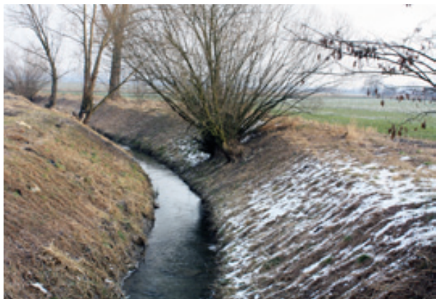
Rzeka Sławka po wykonaniu konserwacji przez Gminną Spółkę Wodną