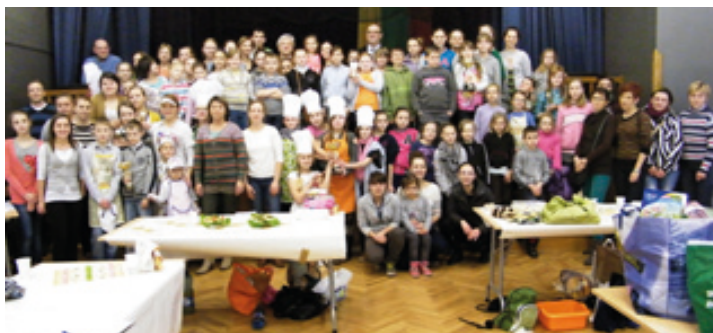
Wspólne zdjęcie uczestników konkursu

16 marca w GCKiS w Kobierzycach odbył się konkurs „II Świetlicowy Mistrz Kuchni”. W imprezie wzięło udział 15 świetlic z Gminy Kobierzyce: Ślęza, Domasław, Damianowice, Jaszowice, Tynec n/Śl., Pełczyce, Magnice, Pustków Żurawski, Krzyżowice, Królikowice, Żerniki Małe, Kulice, Kobierzyce, Owsianka oraz Małuszów.