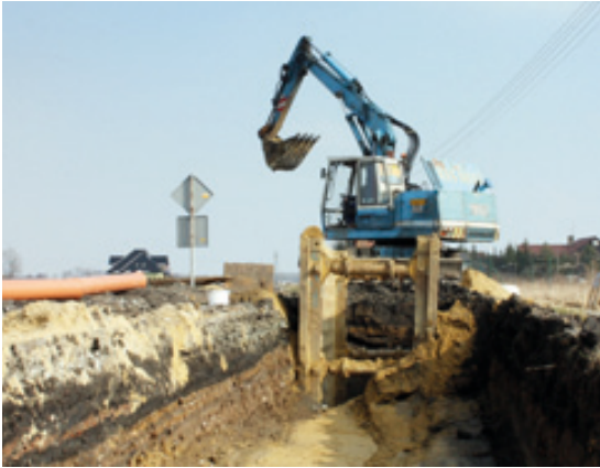
Budowa kanalizacji w miejscowości Owsianka

Gmina Kobierzyce od kilkunastu lat stara się sprostać wymogom unijnym odnośnie ochrony środowiska poprzez budowę zbiorowych systemów odprowadzania ścieków, popularnie zwanych kanalizacją. Na początku wybudowano sieć kanalizacyjną w północnej części, a w 2010 roku ruszyła budowa w południowej części naszej gminy.