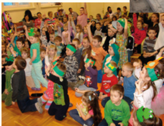
SP w Pustkowie Żurawskim