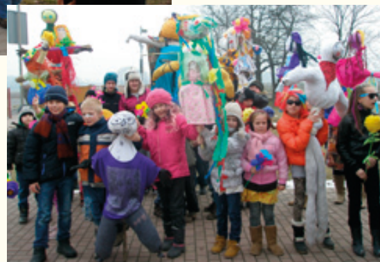
SP w Pustkowie Wilczkowskim