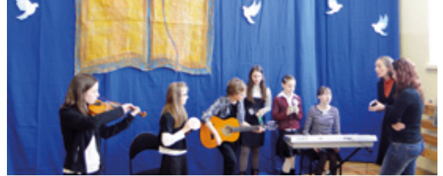
Reprezentacja SP z Tyńca Małego, zdobywcy I miejsca, fot. Krzysztof Pilc

Na nasze zaproszenie odpowiedziały szkoły podstawowe: SP nr 2 z Sobótki, z Mietkowa, Tyńca Małego oraz Bielanych Wrocławskich. Łącznie z gospodarzami, rywalizowało 36 uczestników z sześciu szkół. Tradycyjnie zespoły zmagaly się w 5 konkurencjach. Najtrudniejszą konkurencją dla uczniów był test sprawdzający wiedzę ze znajomości wydarzeń biblijnych Starego i Nowego Testamentu, pisany indywidualnie. Najlepiej w ogólnej punktacji wypadła szkoła z Tyńca Małego, zajmując I miejsce, II miejsce przypadło drużynie gospodarzy, natomiast III szkole z Bielanych Wrocławskich. - Jak się okazuje Pismo Święte można wymalować, wyśpiewać, a nawet wyszeptać w „głuchym telefonie” – stwierdziła Agata Combik, redaktor Gościa Niedzielnego. - Konkurs odbywał się na bar-