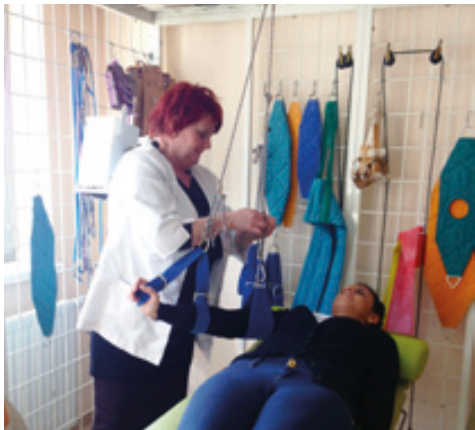
Gabinet rehabilitacyjny w NZOZ Twój Lekarz

Pierwsze miesiące 2013 roku okazały się czasem szczególnie wyjątkowej pracy w polskiej służbie zdrowia. Przyczyniła się do tego grypa i zachorowania grypopodobne. W całym kraju w styczniu zapadło na nie 600 tysięcy ludzi. To sześciokrotnie więcej niż w styczniu 2012 roku. Nasi lekarze przyjęli w tym czasie prawie trzy tysiące osób, u których zdiagnozowali takie zachorowania. Jest to trzy razy więcej niż w zeszłym roku. W chwilach, gdy liczba chorych gwałtownie wzrasta, szczególnie ważna jest nie tylko dobra organizacja pracy personelu, ale również zrozumienie przez pacjentów mechanizmów działania naszych ośrodków zdrowia.