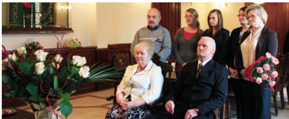
Jubilaci wraz z rodziną