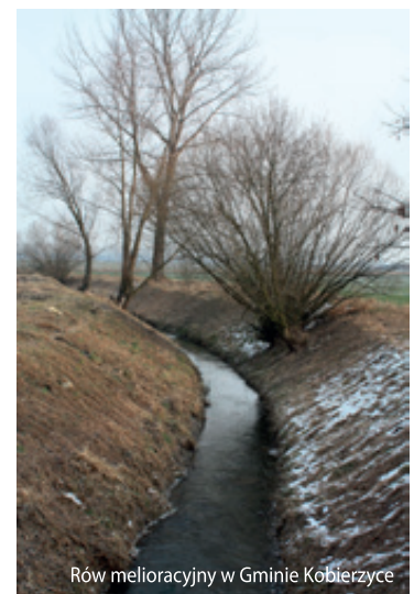
Row melioracyjny w Gminie Kobierzyce