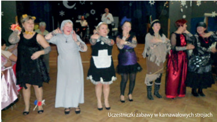
Uczestniczki zabawy w karnawałowych strojach

Zarząd Rejonowy Polskiego Związku Emerytów, Rencistów i Inwalidów w Kobierzycach pragnie zainteresować swoich członków wydarzeniami, które organizuje dla urozmaicenia życia kulturalnego w 2014 roku. Na początku lutego w Sali Widowiskowej GCKiS w Kobierzycach odbyła się zabawa karnawałowa, a wiele osób bawiło się w strojach balowych. Nasze tegoroczne plany to: 17 maja 2014 r. - spotkanie składkowe miłośników tańca i śpiewu pod nazwą „Jajo wielkanocne”; 31 maja 2014 r. - z okazji Dnia Matki organizujemy wyjazd do Ogrodu Botanicznego w Wojsławicach połączony z biesiadowaniem przy ognisku i muzyce; w dniach 7-20 czerwca 2014 r. organizowany jest turnus rehabilitacyjny dla 50-ciu osób nad morzem w Dźwirzynie; 3 sierpnia 2014 r. - planowany jest wyjazd do Gidli i Częstochowy; w dniach 7-10 sierpnia 2014 r. organizujemy 4-dniową wycieczkę krajoznawczą do uroczych zakątków Polski wschodniej (Lublin, Zamość, Kazimierz Dolny, Leżajsk, Ojcowski Park Narodowy); 27 września 2014 r. odbędą się obchody z okazji „Dnia Seniora”;