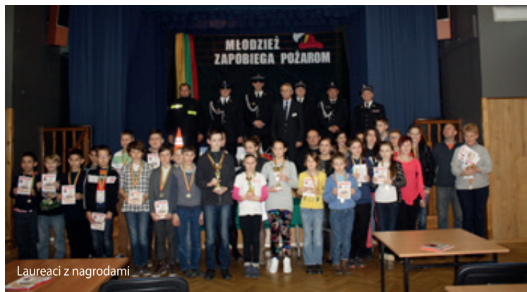
Laureaci z nagrodami