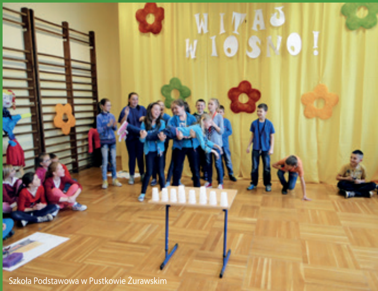
Szkoła Podstawowa w Pustkowie Żurawskim