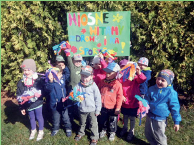
Przedszkole samorządowe w Kobierzycach