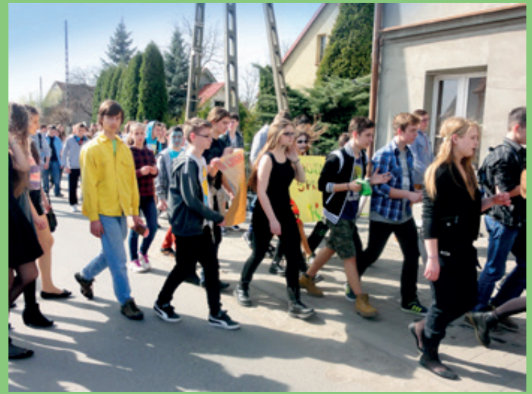
Gimnazjum w Kobierzycach