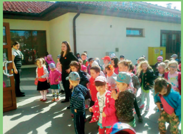
Przedszkole samorządowe w Ślęzie