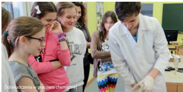
Doświadczenia w pracowni chemicznej

Tradycyjnie w okresie wiosennym Gminny Zespół Szkół im. UNICEF w Bielanych Wrocławskich miał okazję przedstawić swoją ofertę edukacyjną podczas Dni Otwartych