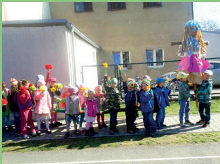
Szkoła Podstawowa w Tyńcu Małym