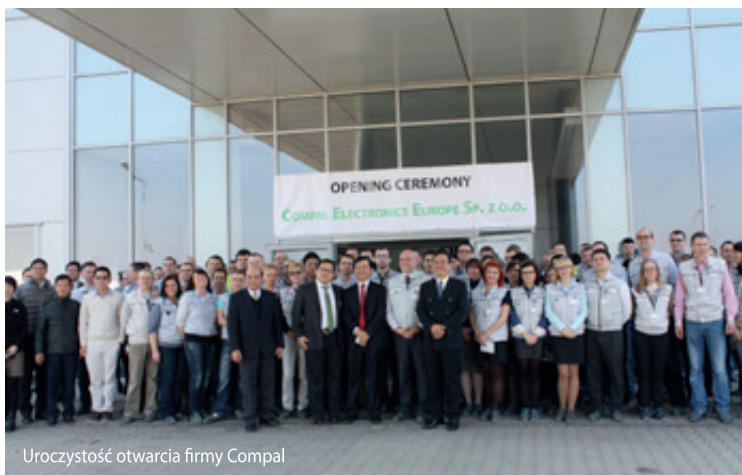
Uroczystość otwarcia firmy Compal