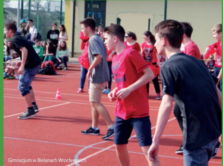
Gimnazjum w Bielanych Wrocławskich