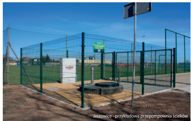
Jaszowice - przykładowa przepompownia ścieków