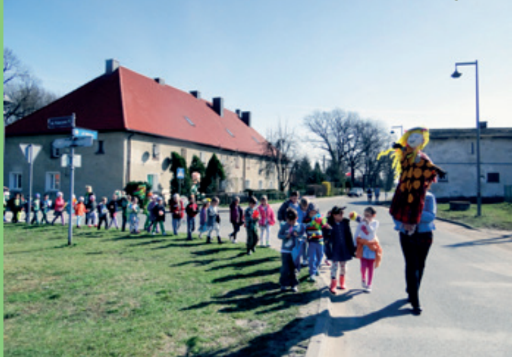
Szkoła Podstawowa w Kobierzycach