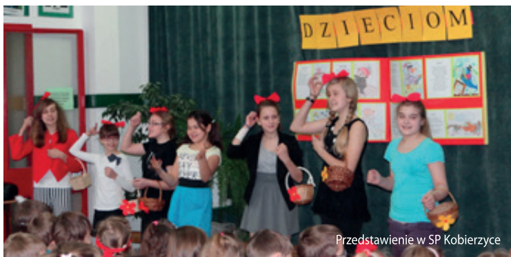
Przedstawienie w SP Kobierzycy

W celu przybliżenia uczniom sylwetek sławnych polskich poetów oraz propagowania czytelnictwa wśród uczniów klas 0-3, w Szkole Podstawowej w Kobierzycach odbyło się przedstawienie „Brzechwa Dzieciom”. W spektaklu wykorzystano utwory takie jak: „Kaczka Dziwaczka”,