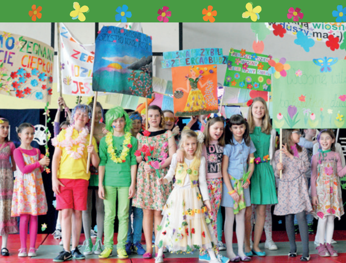
Szkoła Podstawowa w Bielanych Wrocławskich