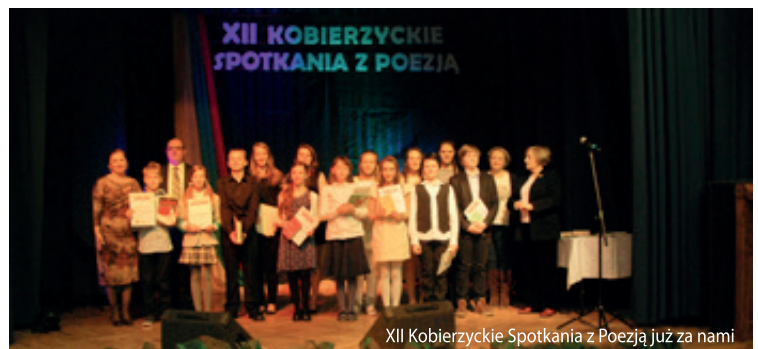
XII Kobierzyckie Spotkania z Poezją już za nami

Gminne Centrum Kultury i Sportu zorganizowało „XII Kobierzyckie Spotkania z Poezją”, w ramach których odbyły się gminne eliminacje dolnośląskich konkursów recytatorskich dla uczniów szkół podstawowych i gimnazjalnych. W zmaganiach na słowa i śpiew wzięli udział wychowankowie GCKiS oraz szkół z terenu Gminy Kobierzyce. Wszyscy zaprezentowali bardzo