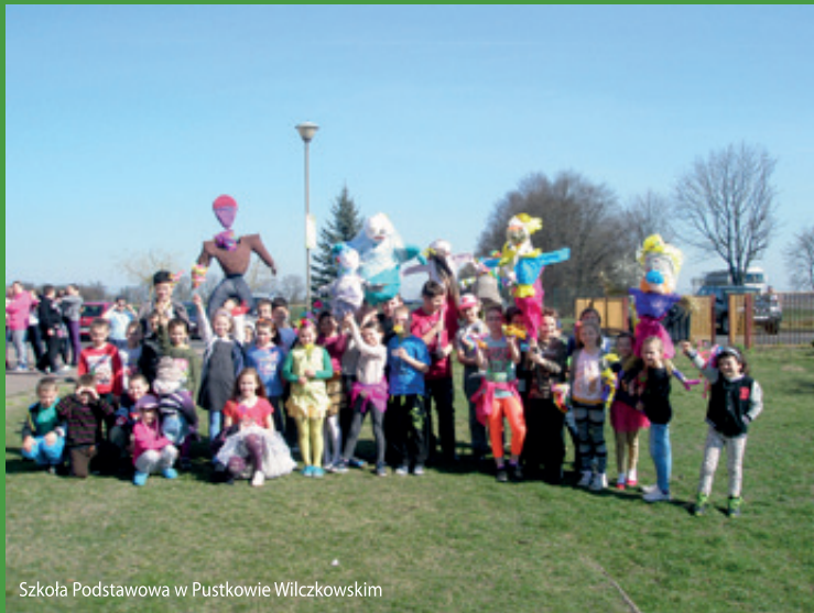
Szkoła Podstawowa w Pustkowie Wilczkowskim

Zima w tym roku, szczególnie w naszym rejonie, w niczym tej mroźnej, śnieżnej, kojarzącej się z Mikołajem i Świętami pory nie przypominała. Ta „zima nie zima”, jednak się kończy i kalendarzowa wiosna, miejmy nadzieję, że pełna barw, zapachów i ciepła zapanuje niepodzielnie. Pierwszy dzień wiosny, obchodzony jest w dniu równonocy wiosennej. W strefie czasowej Polski rozpoczynała się zwykle 21 marca, zaś w miarę przybliżania się końca stulecia coraz częściej 20 marca, tak też będzie w tym roku. Kolejny początek wiosny w dniu 21 marca nastąpi dopiero w roku 2102. Przyczyną zjawiska jest ruch punktu Barana związany z precesją osi rotacji Ziemi.