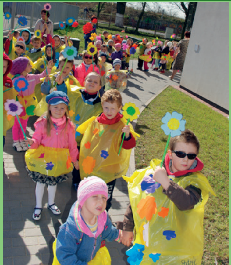
Przedszkole samorządowe w Pustkowie Żurawskim