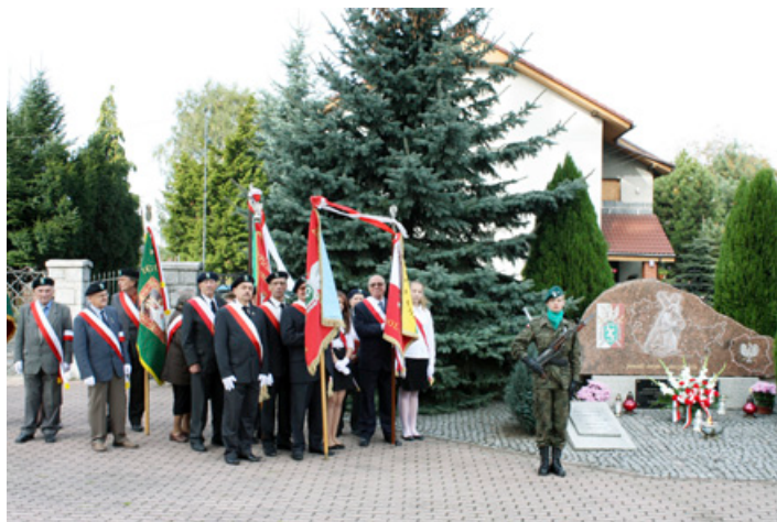
Złożenie kwiatów pod Obeliskiem Zesłańców Sybiru