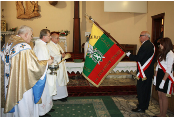
Poświęcenie Sztandaru Gimnazjum w Kobierzycach

Dnia 5 października 2012 r. w kobierzyckim Gimnazjum odbyła się uroczystość nadania szkole imienia Zesłańców Sybiru. Oficjalne obchody rozpoczęła msza święta w kościele parafialnym pod wezwaniem Wniebowzięcia Najświętszej Maryi Panny. Orkiestra Policyjna z Wrocławia uświetniła mszę świętą, podczas której poświęcono sztandar szkoły.