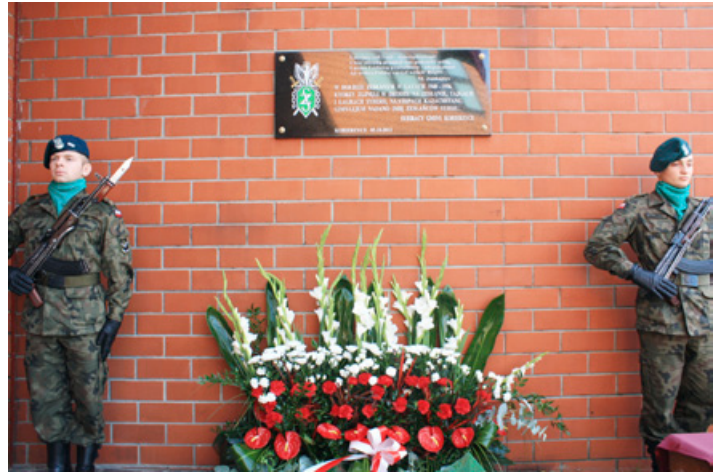
Warta Honorowa przy tablicy pamiątkowej