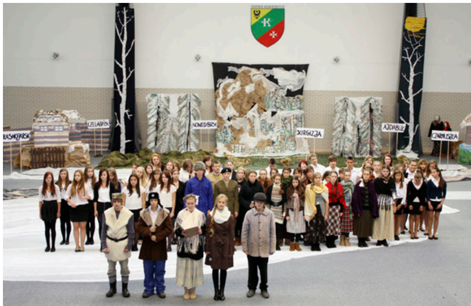
Uczniowie Gimnazjum w Kobierzycach - przedstawienie

„Losy Polaków na Wschodzie w latach: 1939-1956 są jak otwarta księga. Nie da się jej zamknąć... Gdy się tę księgę zacznie czytać, serca wypełniają się prawdą gorzką i smutną... Są w niej fakty i sytuacje przerażające, straszne, niekiedy wręcz potworne, innym razem tylko łagodnie smutne. Słychać płynący z kart tej księgi płacz, krzyk i przekleństwa. Widać dławiących się z bólu i rozpaczających ludzi...”