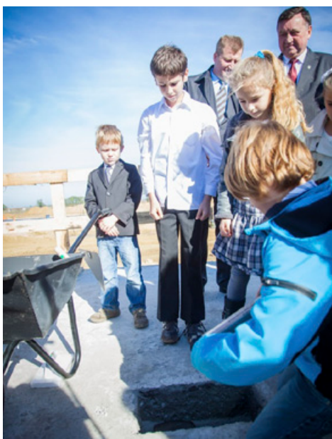
Wmurowanie kamienia węgielnego