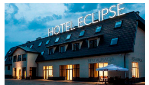
Hotel „Eclipse” w Domasławiu