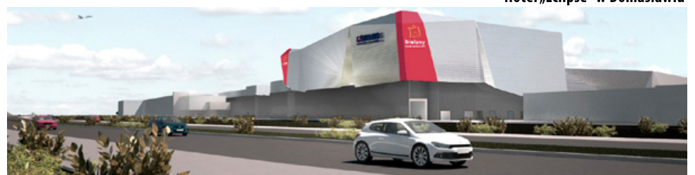
Wizualizacja centrum handlowego w Bielanach Wrocławskich