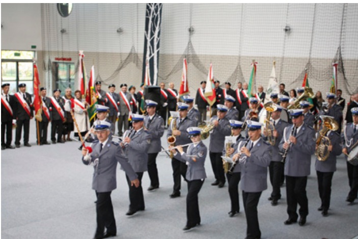
Orkiestra Policyjna z Wrocławia