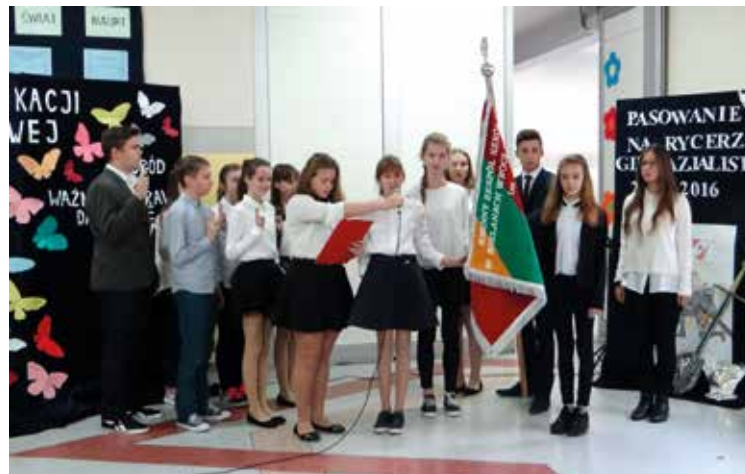
Występ uczniów z bielanieckiego gimnazjum

pełnoprawnych gimnazjalistów. Złożyli ślubowanie, że w codziennej pracy nie będą szczydzić sił w zdobywaniu rzetelnej wiedzy, a swoim zachowaniem, pilnością w nauce i pracy, wyrażać będą szacunek tradycjom szkoły. Postanowili dać