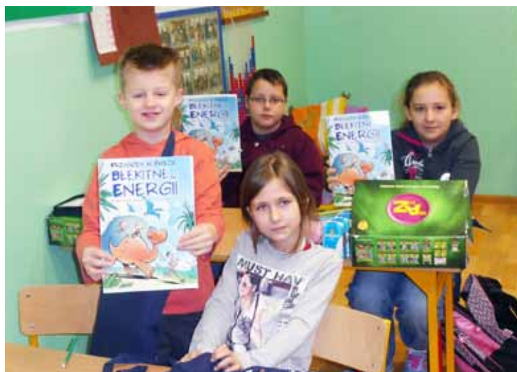
Uczniowie Szkoły Podstawowej w Tyńcu Małym