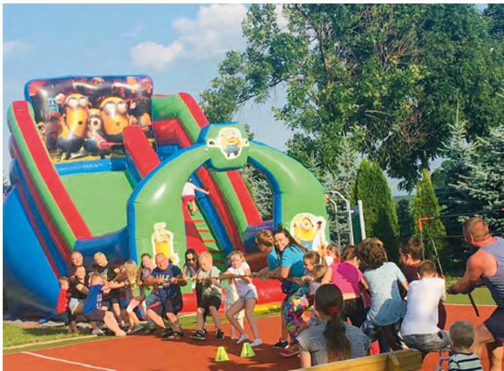
Powitanie lata w Budziszowie