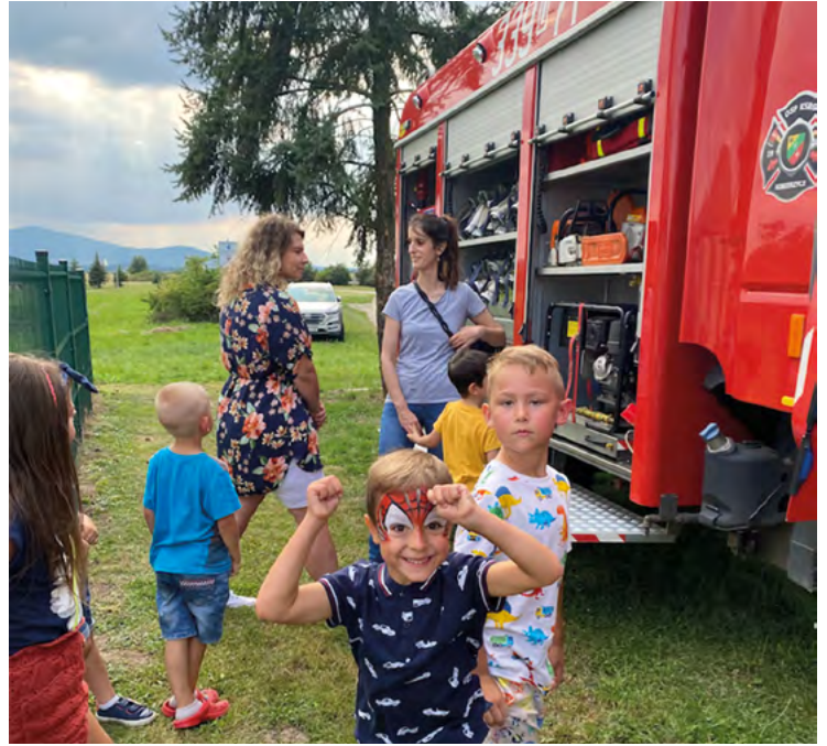
Atrakcje dla najmłodszych podczas pikniku w Damianowicach