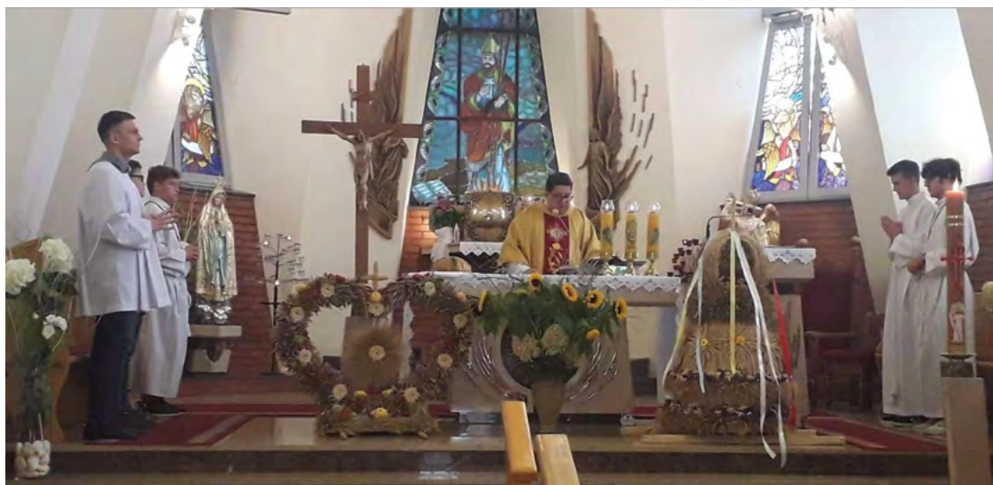
Msza św. dożynkowa w Domasławiu