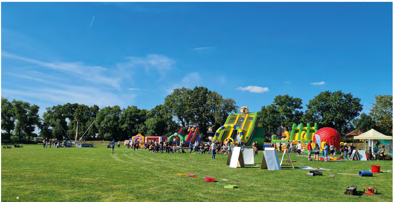
Piknik rodzinny w Pustkowie Żurawskim