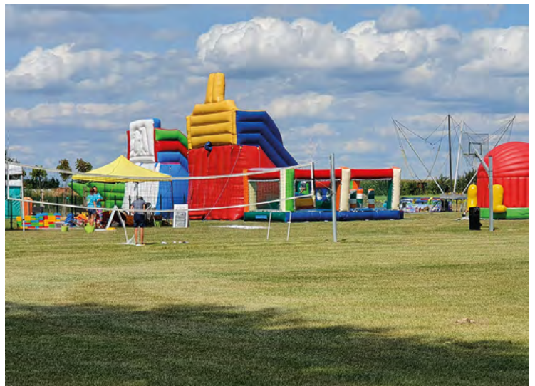
Piknik rodzinny w Żurawicach