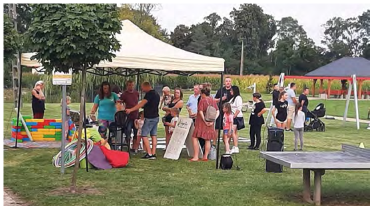
Piknik rodzinny w Cieszycach