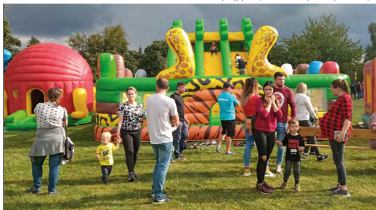
Gry i zabawy w Królikowicach