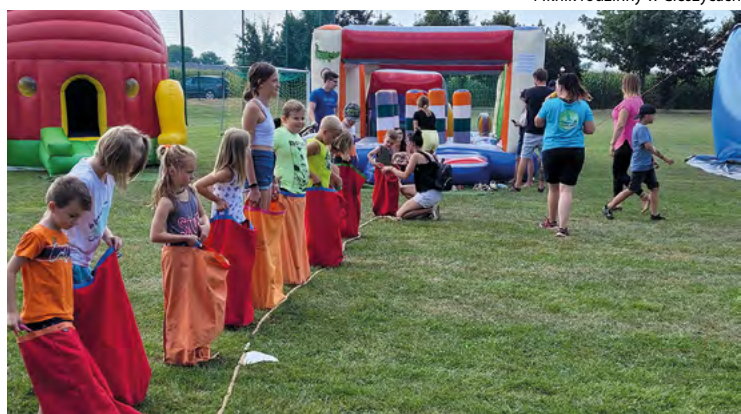
Zabawy podczas pikniku rodzinnego w Żernikach Małych