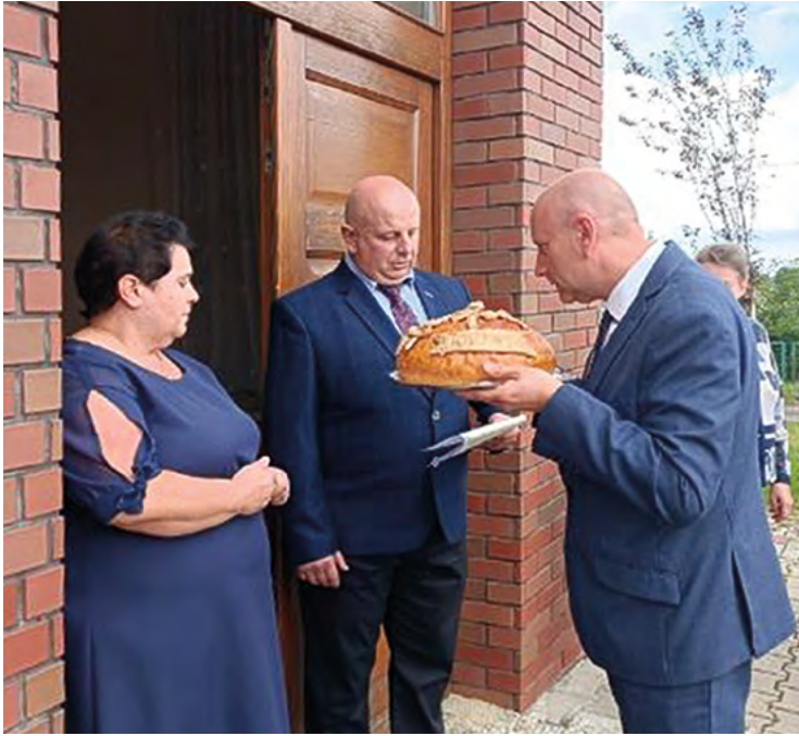
Dożynki w Pustkowie Wilczkowskim