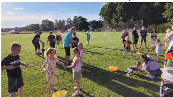
Animacje dla dzieci w Magnicach