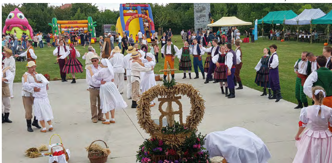
Występy zespołów ludowych w Tyńcu Małym