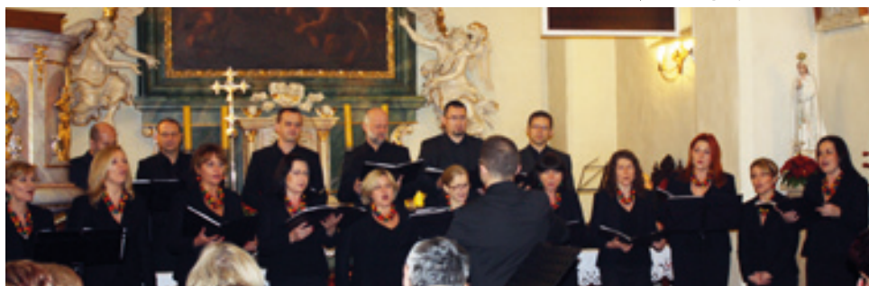
Występ chóru z Bielanych Wrocławskich