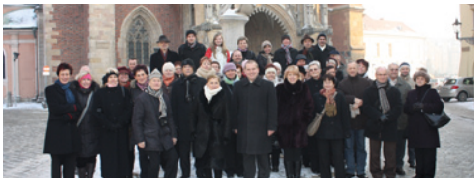
Wizyta delegacji we Wrocławiu

W dniu 08.12.2012 r. w naszej gminie gościła delegacja z czeskich Koberžic. Przyjazd gości z Czech nastąpił w ramach umowy o współpracy między Gminą Koberżyce a miejscowością Koberžice. Organizatorem wizyty był Urząd Gminy Koberżyce.