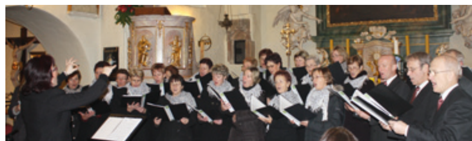
Występ chóru z Koberžic

Program był bardzo urozmaicony, najpierw goście mieli okazję zwiedzić Wrocław, a wieczorem w kościele w Bielanych Wrocławskich odbył się wspólny koncert dwóch chórów – z gminy Koberżyce oraz z gminy partnerskiej.